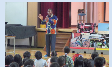
Les enfants découvrent la culture du Togo.

gramme dédié à cinq pays ou régions, présentant leur langue, leur culture et leur histoire, entre autres. Les élèves auront l'opportunité de développer un esprit d'ouverture à l'international en se familiarisant avec ces cultures différentes, par une interaction avec les ambassades, des dialogues menés avec les étudiants étrangers et des échanges de courriels avec les écoles des pays concernés. La jeune génération aussi se prépare pour les Jeux !