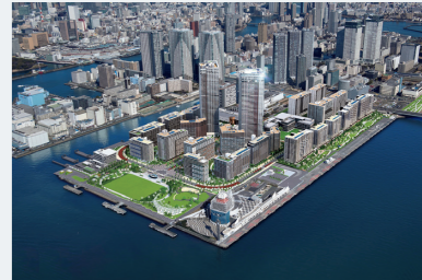
Pour rendre les Jeux olympiques et paralympiques écologiques, on aura recours à l'énergie hydrogène. Ci-dessus, une représentation du village olympique après les Jeux de Tokyo 2020.

C'est en septembre 2013, lors de la 125 e session du Comité international olympique (CIO), à Buenos Aires, que la capitale japonaise a été choisie pour accueillir les JO une deuxième fois, 56 ans après ceux de 1964. Depuis lors, Tokyo n'a eu de cesse de préparer une célébration d'excellence, inouïe.