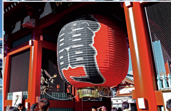
Profitez de la magie de la capitale japonaise pendant les JO de Tokyo 2020 ! De haut en bas et de gauche à droite : la rivière Sumida et la tour Tokyo Skytree, le carrefour de Shibuya et le Kaminarimon à Asakusa.