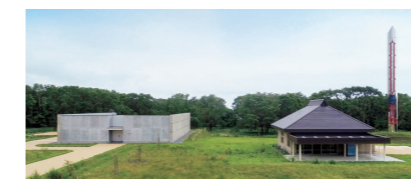
Le site commémoratif honore les défunts du peuple aïnou.