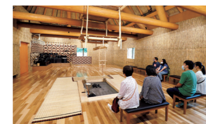
Le kotan (village traditionnel aïnou) regroupe plusieurs maisons reconstituées ( cise ). Les visiteurs peuvent pénétrer à l'intérieur des bâtiments, participer à des cérémonies et essayer des vêtements traditionnels*.

Upopoy comprend le National Ainu Museum, le National Ainu Park, situé sur les rives d'un lac, ainsi qu'un site commémoratif. Le musée expose près de 700 objets. La salle d'exposition permanente est organisée autour de six thématiques : la langue, l'univers, l'existence, l'histoire, le