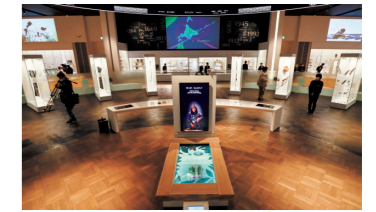
La salle d'exposition permanente du Musée national du peuple aïnou s'articule autour de quatorze vitrines présentant des objets emblématiques de la culture aïnoue.

travail et les échanges. Elle présente un panorama complet de l'histoire et de la culture aïnoues. Le parc a été conçu sur le modèle de l'écomusée et regroupe un village ( kotan ) de maisons reconstituées ( cise ) et des scènes dédiées à la représentation de danses traditionnelles. Les visiteurs peuvent assister à des démonstrations de maniement des outils de chasse et de pêche, des représentations de chants et de danses traditionnelles, ainsi que participer à des ateliers autour de la cuisine et de l'artisanat*.