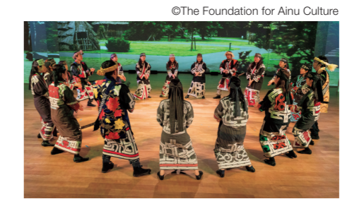
La salle consacrée aux échanges culturels présente des démonstrations de danse et de musique traditionnelles aïnoues.