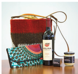
Une partie de la belle sélection d'articles de mode et de cosmétiques de la marque Proudly from Africa.

Le village de Bognayili est situé à deux heures de trajet (en avion ou en voiture) d'Accra, la capitale de la république du Ghana. Dans cette commune où vivent environ 2 000 personnes, une Japonaise soutient depuis dix ans le travail des habitants en promouvant le slogan « Détachons-nous des aides et soyons autonomes en 2022 ».