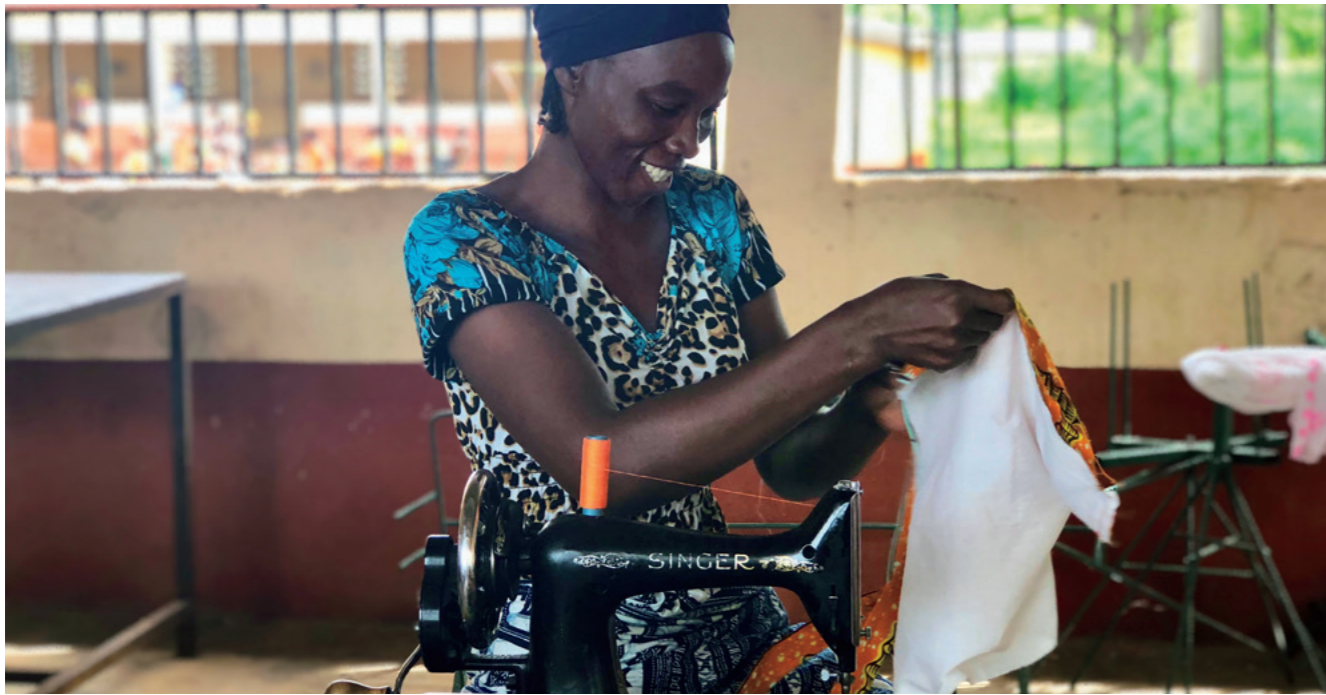
Une femme en train de coudre dans l'usine MY DREAM, à Bognayili. Les femmes ont trouvé différentes façons de recycler des tissus et ainsi d'économiser les matières premières.

AMBASSADEURS DE TERRAIN >>> Contributions japonaises aux quatre coins du monde