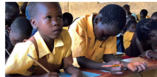
L'école MY DREAM a ouvert avant même d'être meublée. Aujourd'hui, les enfants apprennent sur des pupitres tout en poursuivant leurs rêves.