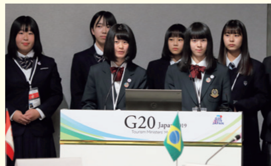
Pour les lycéens, « la première étape pour développer un tourisme durable est d'amener les habitants à réfléchir aux attraits de leur région. »

Les Objectifs de développement durable (ODD) fixés par les Nations unies visent à bâtir une société dans laquelle tous les peuples jouissent de la paix et de la prospérité. Le domaine du tourisme s'inscrit lui aussi dans les exigences des ODD, car son développement constitue un moteur de la croissance économique, crée des emplois et améliore la qualité de vie