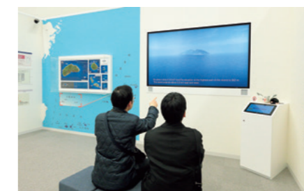
Dans l'espace dédié à Senkaku, l'utilisation d'images de synthèses permet au visiteur de découvrir l'environnement des îles du point de vue d'un albatros à queue courte, un oiseau qui vit sur les îles Minamikojima et Kitakojima.