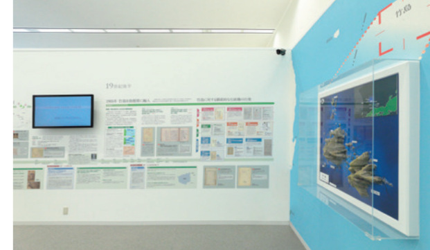
L'espace dédié à Takeshima propose notamment des panneaux d'affichage, des images vidéo et un diorama du territoire. Des preuves et des documents étayant la réfutation japonaise côtoient les allégations formulées par la Corée du Sud.

Takeshima fait incontestablement partie intégrante du territoire japonais. En dépit de ces évidences, l'occupation illégale de l'île par la Corée du Sud perdure. Le Japon demeure résolu à trouver un règlement au litige en s'appuyant sur le droit international, et ce de manière calme et pacifique.