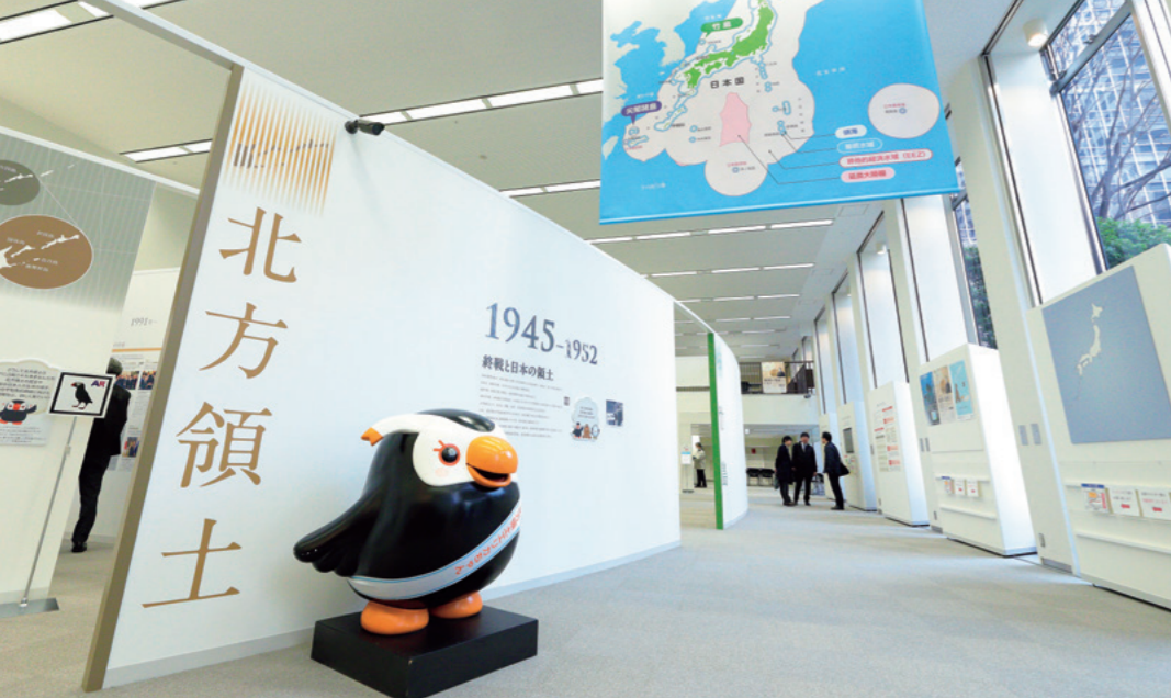
Le musée est désormais également ouvert les weekends et les jours fériés (il est fermé le lundi). Les visiteurs sont accueillis par Erica-chan, la mascotte des Territoires du Nord. Entrée gratuite. Adresse : 3-8-1 Kasumigaseki, Chiyoda-ku, Tokyo.

L'espace dédié aux Territoires du Nord utilise la technique de projection cartographique pour permettre aux visiteurs de visualiser le déroulement de l'invasion et de l'occupation des Territoires du Nord par l'Union soviétique. Les spectateurs peuvent aussi y découvrir la vie des habitants des îles japonaises avant la guerre.