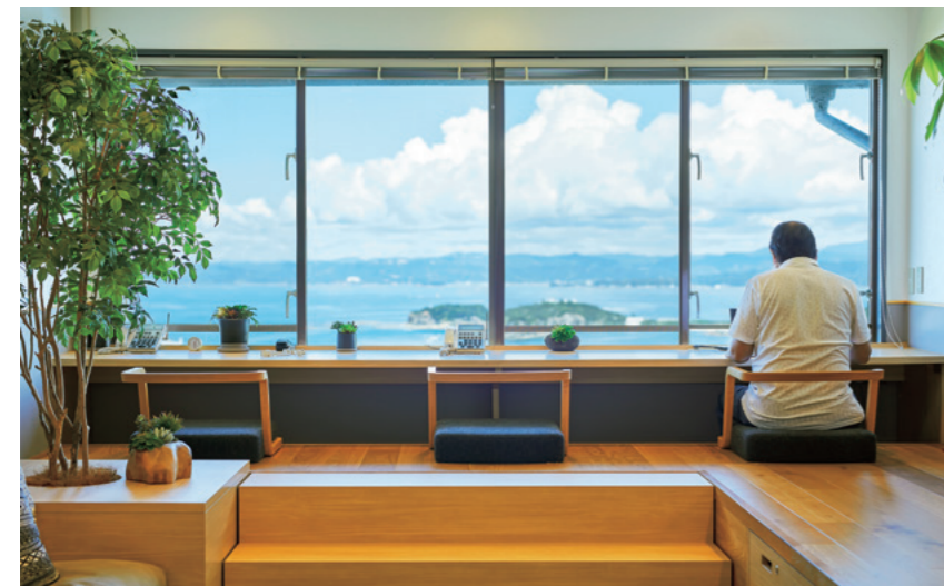
Vue panoramique sur l'océan depuis les bureaux de NEC Solution Innovators à Shirahama. L'espace décloisonné encourage une meilleure communication au sein du lieu de travail.

Shirahama, une ville située dans la préfecture de Wakayama, dans l'ouest du Japon, a longtemps prospéré en tant que destination touristique grâce à son climat doux, sa magnifique côte, ses sources thermales et ses magnifiques paysages. Grâce à son emplacement idéal – à seulement une heure de vol de Tokyo – de plus en plus d'entreprises ont récemment installé des bureaux satellites dans la ville, remaniant leurs méthodes traditionnelles de travail en laissant leurs employés travailler tout en profitant des commodités de cette région touristique. Plus tôt en 2020, alors que la pandémie faisait du télétravail une réalité pour de nombreux travailleurs et leur offrait l'opportunité de travailler en dehors de leurs bureaux, Shirahama est apparue comme une