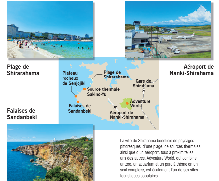
Plage de Shirahama

Les efforts fournis par les entreprises dans la ville récompensent ainsi les salariés par un meilleur équilibre entre vie professionnelle et vie privée, tout en stimulant l'économie locale : une situation gagnant-gagnant. Même après la fin de la pandémie, il y aura sans aucun doute encore plus de personnes – pas seulement des entreprises – qui déménageront à la recherche d'un nouveau mode de vie professionnel. Shirahama, une ville touristique qui attire une population de plus en plus diversifiée, émet de vives lueurs d'espoir en faisant émerger un aspect positif de ces temps difficiles. ✨