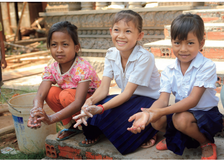
Niños lavándose las manos en un lavabo con mucho entusiasmo. Las escuelas que han introducido con éxito hábitos de lavado de manos han visto una notable reducción en problemas causados por enfermedades infecciosas, como la diarrea.