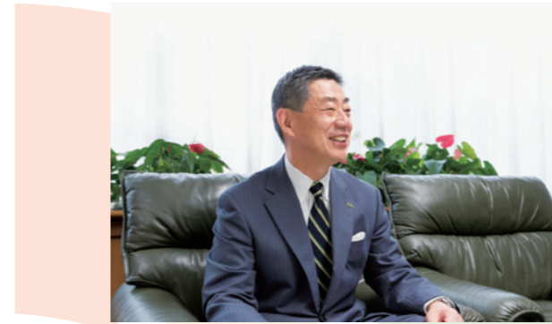
“Todavía tenemos mucho trabajo por hacer para que los estándares japoneses de lavado de manos se vuelvan normales en todas partes”, subraya el presidente Saraya. Él mismo ha viajado a Uganda para sensibilizar en el lavado de manos.

Saraya, con el objetivo de mejorar la higiene del mundo, ha estado activa por muchos años en Asia y África. Un ejemplo notable es “Wash A Million Hands!”, un proyecto implementado en Uganda desde 2010. En este proyecto, Saraya apoya la iniciativa de UNICEF de promover el lavado de manos mediante la donación de parte de sus ventas. Las