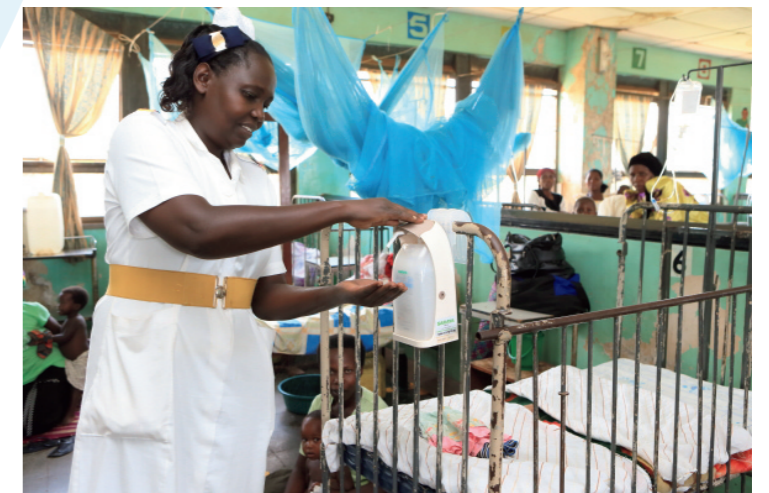
Comprender la importancia de desinfectarse bien las manos y los dedos lleva a un cambio de comportamiento, que se vincula a una reducción medible de las infecciones intrahospitalarias. Para lograrlo, Saraya trabaja energicamente para sensibilizar al personal sanitario en la gestión de la higiene.

compañía ha incorporado los ODS en sus objetivos de actuación corporativa y sigue participando en diversos programas en las áreas de medio ambiente y salud, además de higiene. Esos programas incluyen actividades como preservación de selvas tropicales en regiones productoras de aceite de palma, una materia prima para el jabón y el limpiador, y la sensibilización de los consumidores en el consumo ético. Este impulso, generado por esfuerzos conjuntos tanto individuales como empresariales, permitirá alcanzar con éxito los ODS a una escala global. ✨