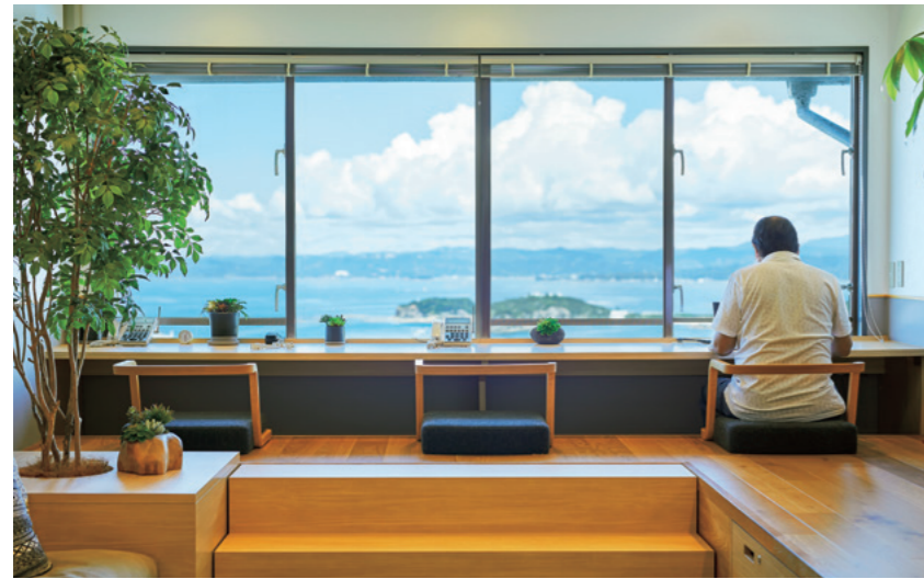
La vista panorámica al océano tal como se aprecia desde el Centro Shirahama de NEC Solution Innovators. El espacio diáfano fomenta una mayor comunicación en el lugar de trabajo.

Shirahama, un pueblo situado en la prefectura japonesa occidental de Wakayama, ha prosperado por mucho tiempo como destino turístico debido a su clima cálido, su bonita costa, sus aguas termales y su pintoresco paisaje. Gracias a su conveniente ubicación, apenas a una hora de vuelo de Tokio, cada vez más empresas vienen estableciendo oficinas satélite en el pueblo, renovando sus estilos de trabajo tradicionales al permitir que los empleados trabajen mientras disfrutan de las comodidades del complejo turístico. A inicios de 2020, cuando la pandemia transformó el teletrabajo en una realidad para muchos trabajadores y les ofreció oportunidades para trabajar fuera de la oficina, Shirahama pasó a ser el