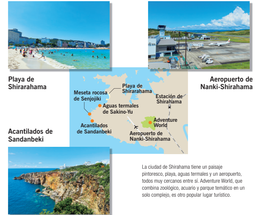
La ciudad de Shirahama tiene un paisaje pintoresco, playa, aguas termales y un aeropuerto, todos muy cercanos entre sí. Adventure World, que combina zoológico, acuario y parque temático en un solo complejo, es otro popular lugar turístico.

De esta manera, los esfuerzos de las empresas en el pueblo están permitiendo a los empleados alcanzar un mejor equilibrio entre vida familiar y laboral, a la vez de estimular la economía local, una situación en la que todos ganan. Incluso tras el final de la pandemia, sin duda alguna habrá más personas, no solo empresas, que cambiarán de ubicación para explorar un nuevo estilo de vida laboral. Shirahama, un pueblo turístico que atrae a una gama cada vez más diversa de personas, es un brillante signo de esperanza de que puede haber un respiro en estos tiempos difíciles. ✨