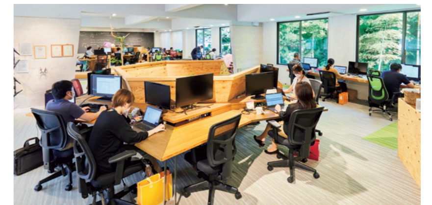
La oficina de QualitySoft está inmersa en una arboleda. La mayoría de las áreas interiores, diseñadas para ofrecer un cómodo entorno de trabajo, se construyeron con madera producida localmente.