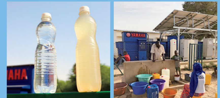
El sistema es gestionado de forma independiente por un comité formado por los mismos residentes.