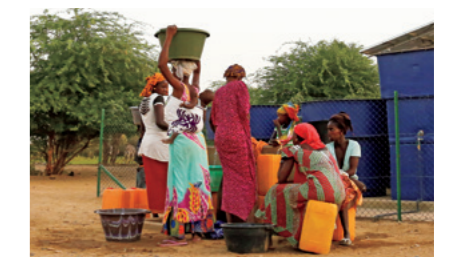
Las mujeres, que antes tenían que cargar agua desde fuentes lejanas, pueden ahora emplear su tiempo en otras tareas.

Asegurar el acceso al agua potable es uno de los Objetivos de Desarrollo Sostenible (ODS). El agua es, además, indispensable para eliminar la pobreza y mejorar la salud, que también son importantes objetivos de este programa. Proveer agua potable en asociación con los residentes de cada lugar brinda un inestimable apoyo a las generaciones jóvenes que son las responsables del futuro. ✨