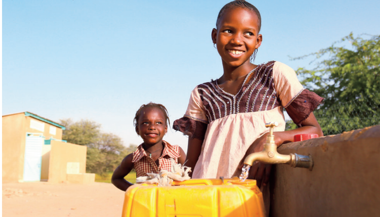
Los niños disfrutan ahora del agua potable y su bienestar también está mejorando.

El Sistema de Suministro de Agua Potable de Yamaha produce agua potable a razón de 8.000 litros por día, suficiente para cubrir las necesidades de unas 2.000 personas. Las comunidades agrícolas pobres son las más necesitadas de agua