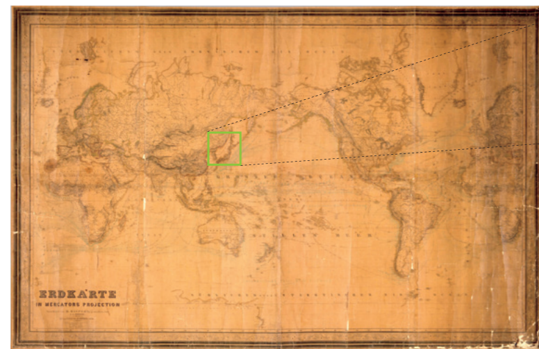
Mapa del mundo creado en Alemania en 1856

existen otros muchos casos de mares cuyo nombre ha sido fijado de este modo, entre los que podríamos citar el Mar de Andamán, separado por las islas homónimas del resto del Océano Índico, o el Golfo de California, del que igualmente puede decirse que está separado del resto del Océano Pacífico por la península homónima.