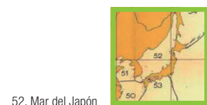
52. Mar del Japón

La publicación del OHI "Límites de los mares y océanos" usa solo el nombre de Mar del Japón para el área correspondiente