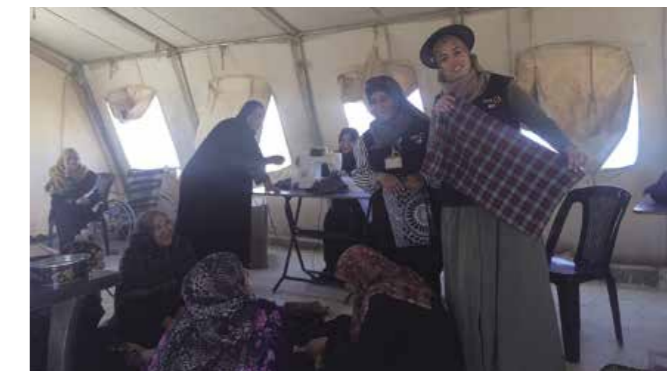
Con el eslogan “Mi familia y otra familia”, las mujeres comenzaron actividades para ayudarse mutuamente, como por ejemplo, llevar comidas a hogares vulnerables en el campamento. “Este espíritu sirio es similar a omotenashi, o la hospitalidad japonesa”, señala un miembro del personal local.