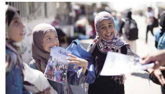
Proyectos en medios de comunicación: además de producir revistas, JEN transmite videos producidos por refugiados para el mundo. Flowers Blooming in the Desert (Flores que crecen en el desierto) fue nominada como finalista en el United For Peace Film Festival 2016.

Kuroki y su equipo tienen un taller de capacitación de periodistas y formación profesional para dar esperanza para el futuro a los jóvenes que enfrentan una estadía prolongada en el campamento. Este esfuerzo ha dado sus