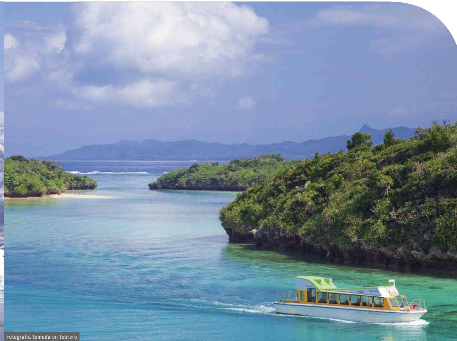
Fotografía tomada en febrero