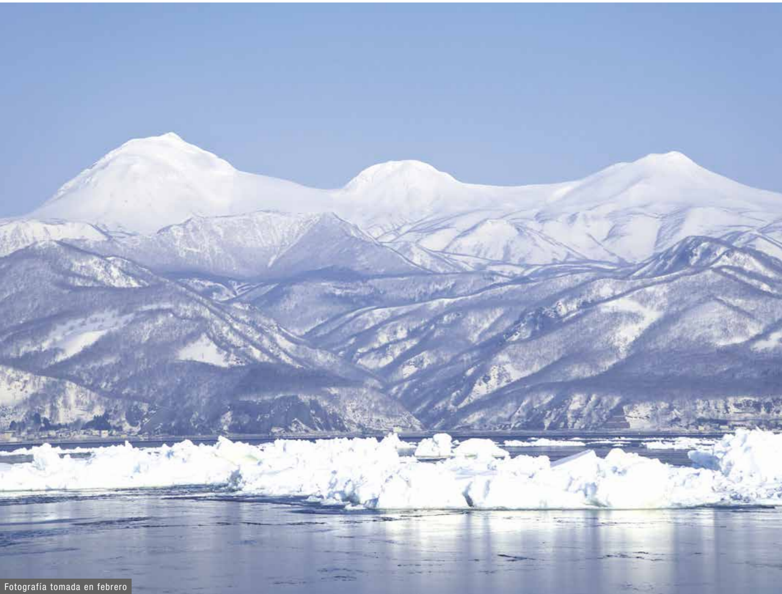
Fotografía tomada en febrero

► Para obtener más información, visite la siguiente página web (en inglés): http://www.yaeyama.or.jp/e.kg.hp.transer.com/