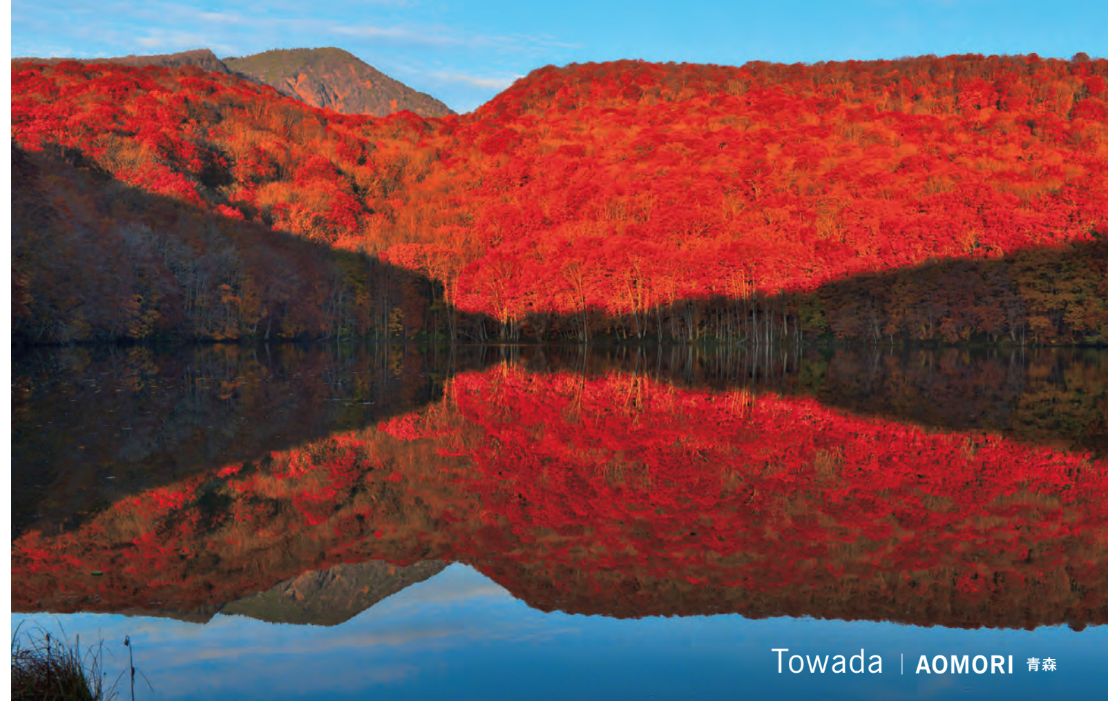
Towada | AOMORI 青森

L'automne, lorsque les arbres verdoyants changent pour des jaunes ardents et des rouges brûlants, et ici, où des mers de fleurs de cosmos s'élancent dans le paysage.