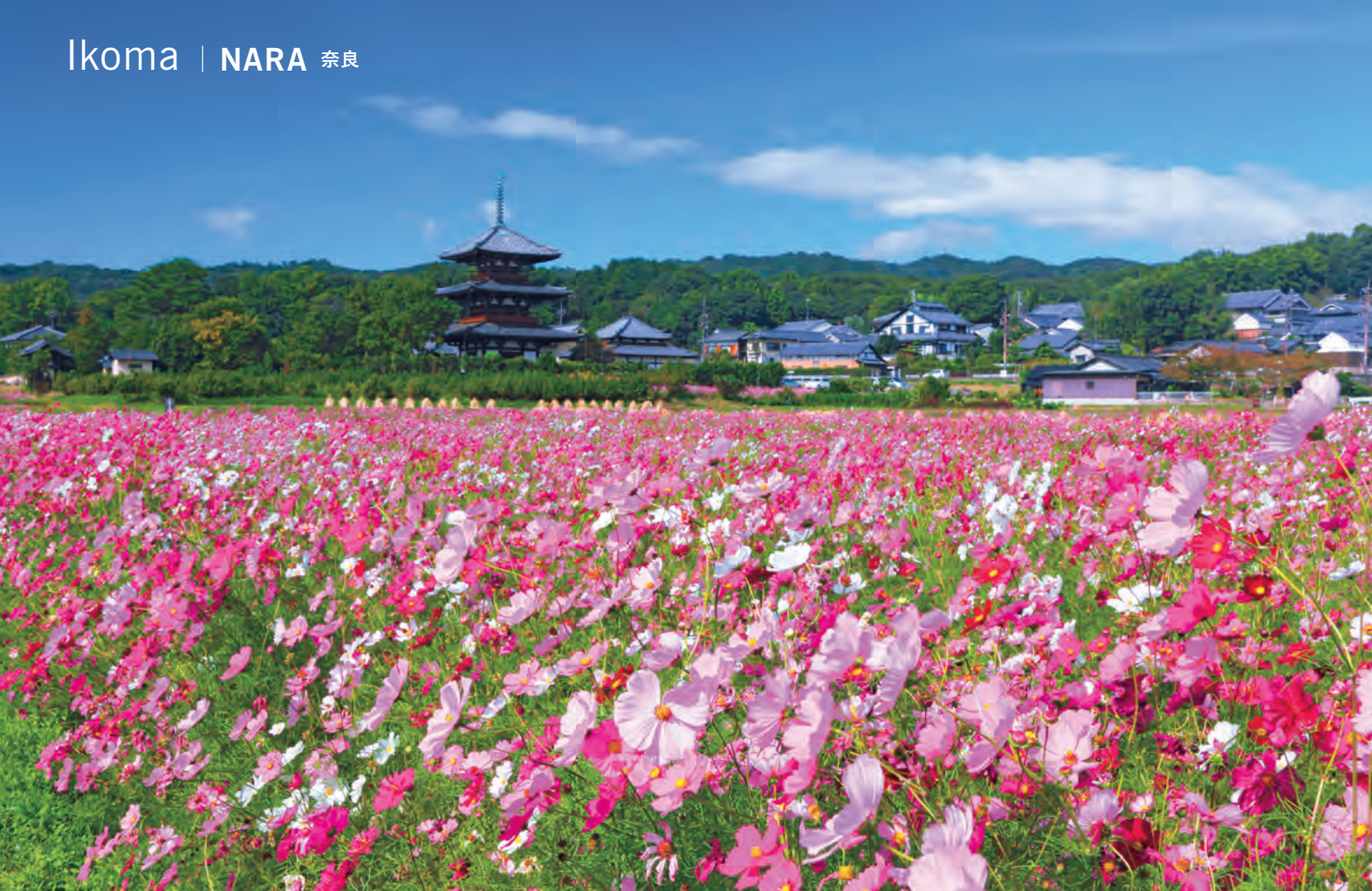
Ikoma | NARA 奈良