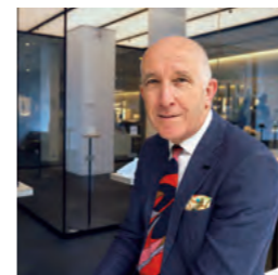
Michael Houlihan es el director general de Japan House London. Como líder y defensor de la cultura, ha ocupado cargos como el de director del Museo Horniman, en el sur de Londres, director ejecutivo de Museos y Galerías Nacionales de Irlanda del Norte, director general de Amgueddfa Cymru -Museo Nacional de Gales- y director ejecutivo del Museo de Nueva Zelanda Te Papa Tongarewa. Ha publicado y dado conferencias a escala internacional sobre museología, diplomacia cultural y memorialización de conflictos.