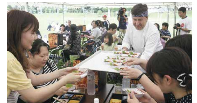
Depuis le tremblement de terre de 2011, Kamaishi a reçu toutes sortes de soutiens de l'étranger pour aider à une reconstruction rapide. Parmi ces soutiens, on peut citer la visite dans la ville d'un groupe de chefs renommés de New York conduit par Daniel Boulud dans le cadre de l'initiative « NY Cooks for Tohoku ». Ces cuisiniers sont venus à Kamaishi en juillet 2011 pour servir des repas aux personnes évacuées, ainsi que pour montrer au monde que le Japon et les produits alimentaires japonais étaient sûrs.