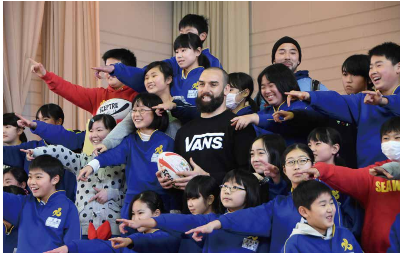
Scott Fardy a échangé avec 60 élèves de CM2 sur les conséquences du Grand séisme de l'Est du Japon dans une école primaire de Kamaishi, et a pris du plaisir à jouer avec eux au tag rugby (une version du rugby destinée aux débutants).

L'initiative « Host Town » est un projet que le gouvernement japonais promeut auprès de collectivités locales dans l'ensemble du pays en préparation des Jeux olympiques et paralympiques de Tokyo 2020. C'est un projet original destiné à créer des occasions d'échanges basés sur le sport entre les résidents locaux et les gens du monde entier, en tirant avantage des JO non seulement à Tokyo, mais aussi à travers le Japon.