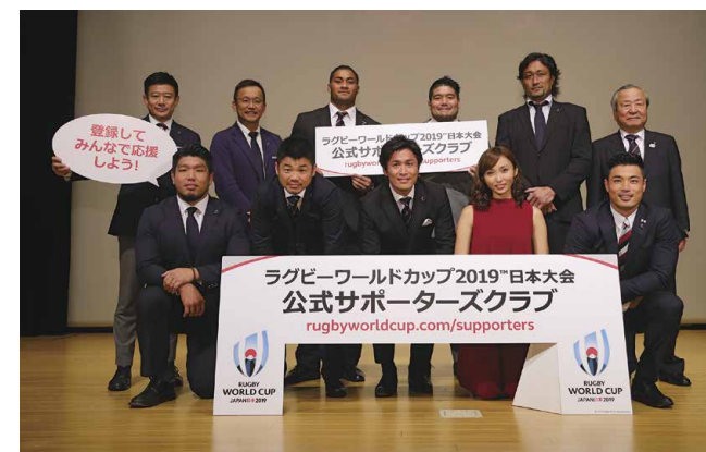
Le club officiel des supporters recrute des membres ! C'est juste l'une des nombreuses activités actuellement réalisées pour faire de la Coupe du monde de rugby 2019 un succès. L'objectif est de remplir entièrement les stades pour l'ensemble des 48 matchs.

La Coupe du monde de rugby 2019 est un événement très important pour le développement du rugby. « La RWC 2019 sera la première Coupe du monde organisée en Asie. Nous espérons que le plus grand nombre possible de spectateurs venant des pays d'Asie éprouvera de l'enthousiasme et un attrait pour le rugby. Le succès de ce tournoi sera une occasion idéale pour propager le rugby dans toute l'Asie », explique M. Shimazu.