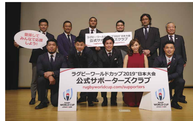
¡El Club Oficial de Seguidores busca nuevos miembros! Esta es solo una de las muchas actividades en curso para asegurar que la RWC 2019 de Japón sea exitosa. El objetivo es llenar completamente los estadios de los 48 partidos.

La RWC 2019 de Japón es muy importante para el desarrollo del rugby. En palabras de Shimazu, “la RWC 2019 de Japón es la primera RWC que se celebra en Asia. Nos gustaría que el mayor número posible de gente de Asia viniera y experimentara de primera mano la emoción y la atracción del rugby. El éxito de este torneo será una oportunidad ideal para expandir el rugby por todo el continente”.