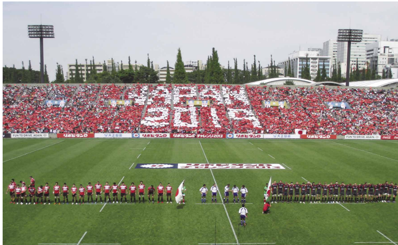
Copa del Mundo de Rugby 2019™ http://www.rugbyworldcup.com/

“Conectar, crear, avanzar” es la visión para el torneo japonés, y significa “conectar con gente de Japón, de Asia y de todo el mundo para crear una celebración innovadora e inclusiva del rugby y de la comunidad, avanzando como uno solo, para construir un futuro mejor para todos”.