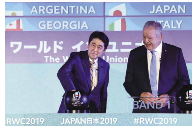
El primer ministro Shinzō Abe asistió al sorteo de grupos de la RWC 2019 que tuvo lugar en Kioto. Fue la primera vez que el sorteo de grupos se llevó a cabo en un lugar distinto a Inglaterra o Irlanda.

Cuando se anunció en 2009 que la RWC se celebraría finalmente en Japón, el equipo nacional japonés comenzó a entrenar aún más duro para mejorar su rendimiento y alcanzar un nivel digno para representar al país anfitrión. El entrenamiento extra dio sus frutos en la última RWC: aunque el equipo japonés no pudo avanzar y llegar a las finales, luchó duramente y obtuvo tres victorias en sus partidos del grupo. En particular, el equipo impresionó al mundo con su dramático tanto ganador justo antes del final del partido con Sudáfrica. Fue una remontada gracias a la cual el equipo obtuvo el premio al Mejor Momento de la RWC, un premio que había sido establecido recientemente para este torneo. La imagen de los jugadores japoneses junto con los jugadores foráneos compitiendo como un solo equipo ayudó a elevar el nivel de emoción del rugby, que llegó a su punto culminante en todo Japón.