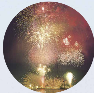
Fuegos artificiales de inauguración de las fiestas del río Ishinomaki — 1 de agosto de 2017

Alrededor de 6.000 fuegos artificiales iluminarán el cielo de estas fiestas en 2017. Estas fiestas comenzaron como muestra de gratitud del pueblo por las bendiciones que reciben del río y para honrar a sus antepasados, y se han venido celebrando todos los años durante los últimos 90 años, incluso cuando se han producido desastres naturales.