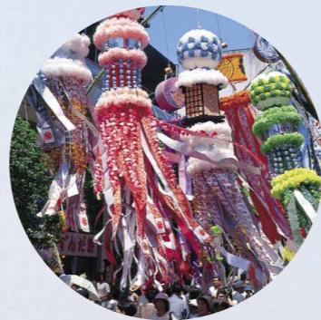
Fiesta de Tanabata de Sendai — del 6 al 8 de agosto de 2017

Alrededor de 6.000 fuegos artificiales iluminarán el cielo de estas fiestas en 2017. Estas fiestas comenzaron como muestra de gratitud del pueblo por las bendiciones que reciben del río y para honrar a sus antepasados, y se han venido celebrando todos los años durante los últimos 90 años, incluso cuando se han producido desastres naturales.