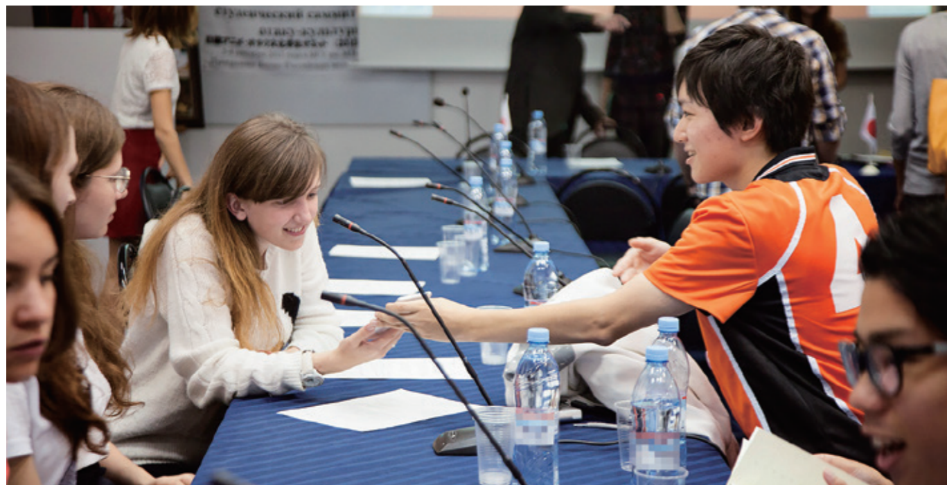
В Университете Кобе Гакуин используется уникальная форма обмена, основанная на субкультурах. Оживленные мероприятия, наполненные общением между японскими и российскими студентами, состоялись в Москве в 2015 г. и в Кобе в 2016 г.