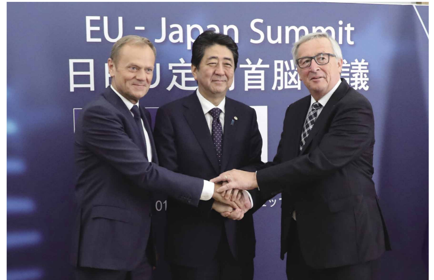
Rencontre avec S.E.M. Donald Tusk, président du Conseil européen et S.E.M. Jean-Claude Juncker, président de la Commission européenne, dans le cadre d'un sommet ordinaire entre le Japon et l'UE à Bruxelles, en Belgique et conférence de presse. Les trois personnalités ont confirmé les principes de l'Accord de partenariat économique (APE) et de l'Accord de partenariat stratégique (APS) entre l'UE et le Japon (juillet 2017).