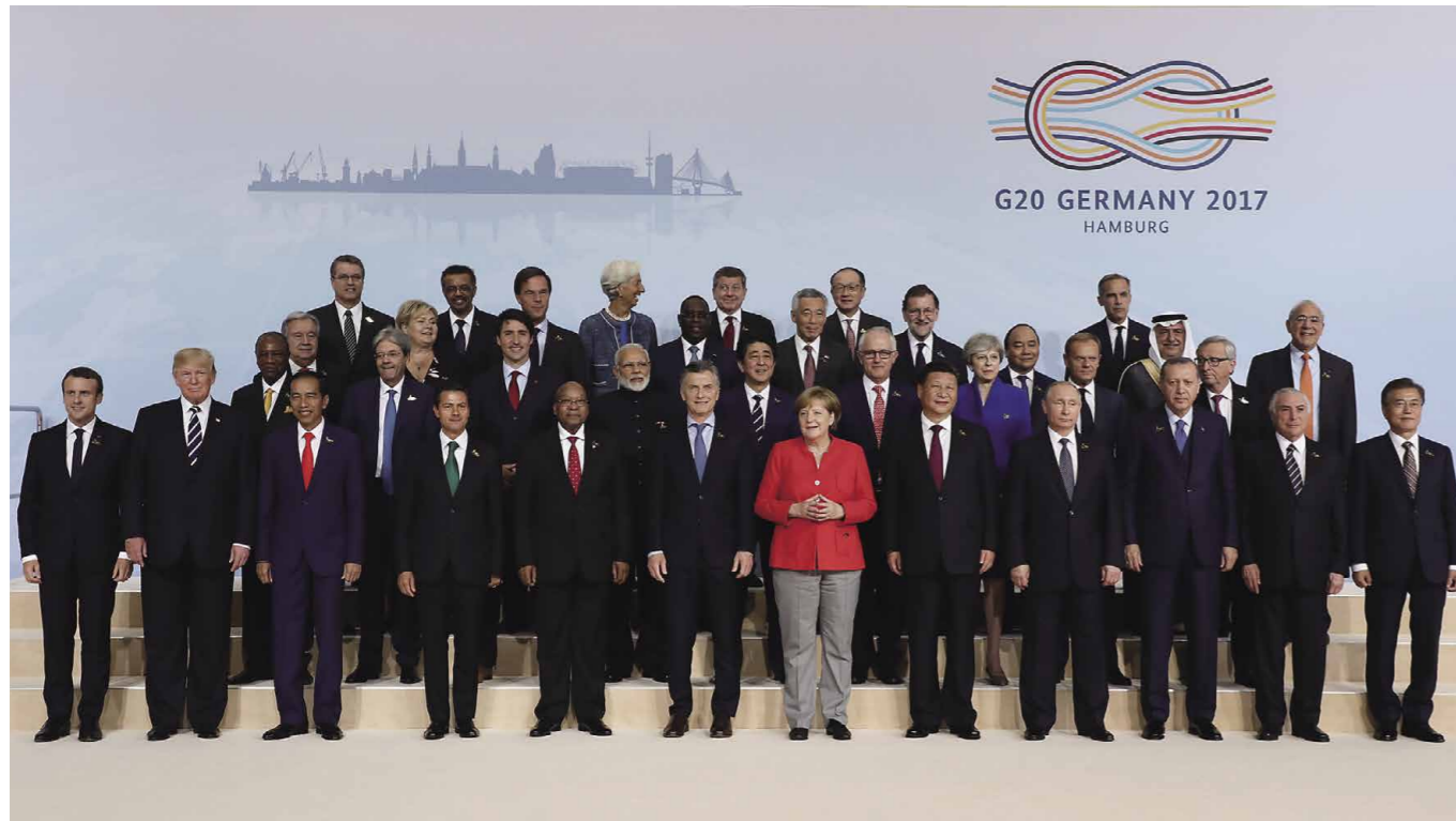
Participation au Sommet du G20 sur les marchés financiers et l'économie mondiale présidé par S.E. Mme Angela Merkel, chancelière de la République fédérale d'Allemagne, dans le cadre de sa visite à Hambourg, en République fédérale d'Allemagne. Le G20 est le premier forum pour la coopération économique internationale et le Premier ministre Abe a mené la discussion des dirigeants en tant qu'orateur principal lors de la Session 1 sur la « Croissance économique et le Commerce », qui traitait des principaux problèmes auxquels le G20 est confronté (juillet 2017).