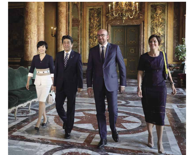
Participation à un dîner à Bruxelles, en Belgique, avec S.E.M. Charles Michel, Premier ministre du Royaume de Belgique (juillet 2017).