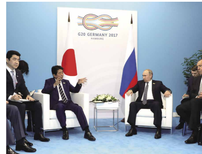
Rencontre avec S.E.M. Vladimir Vladimirovitch Poutine, président de la Fédération russe, à Hambourg en Allemagne (juillet 2017).