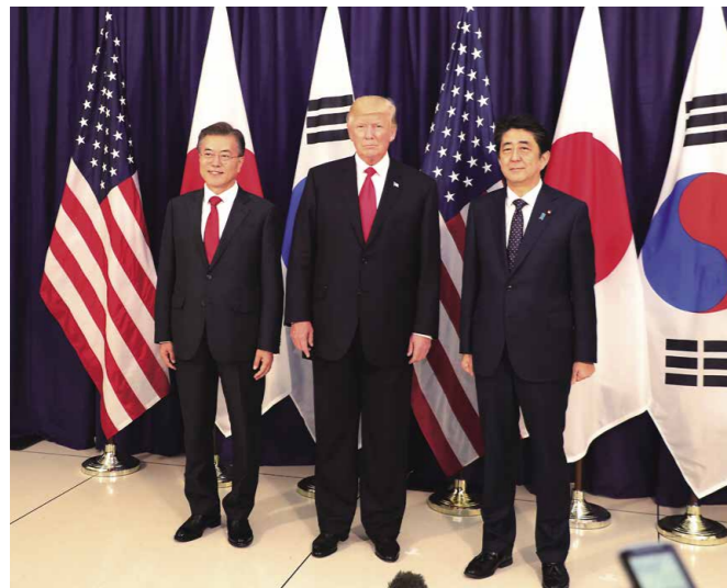
Rencontre avec S.E.M. Donald J. Trump, président des États-Unis d'Amérique et S.E.M. Moon Jae-in, président de la République de Corée, à Hambourg, en Allemagne (juillet 2017).