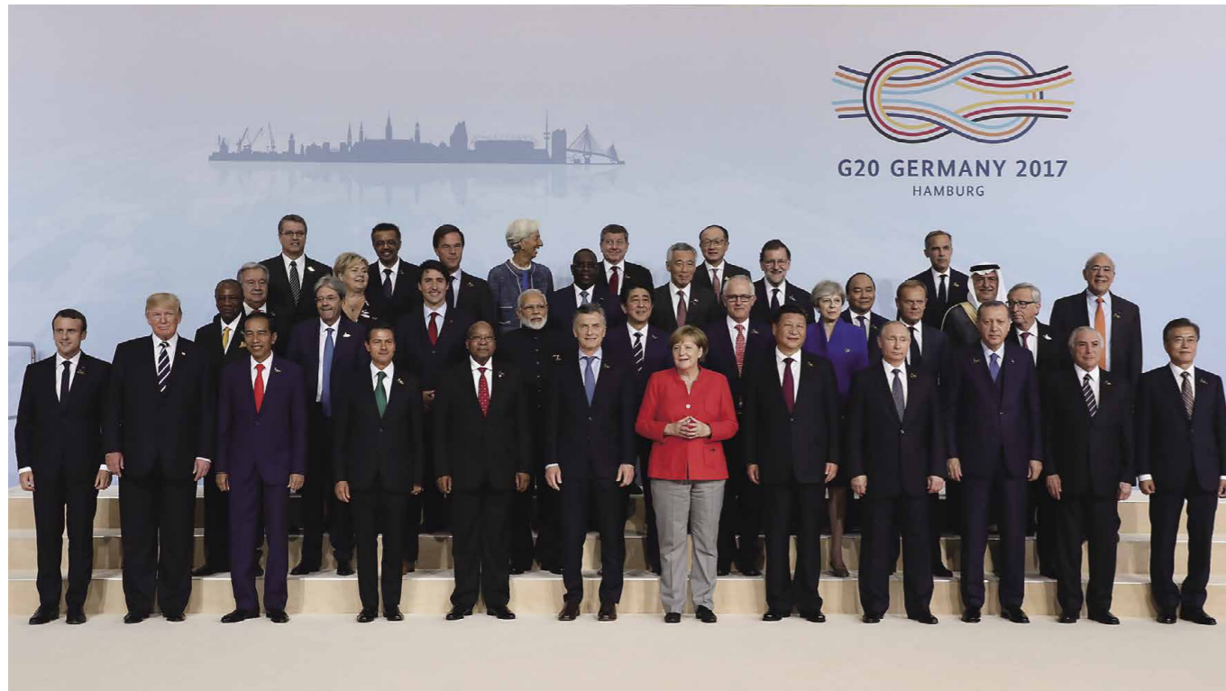
Asistió a la Cumbre del G20 sobre los mercados financieros y la economía mundial, presidida por la canciller Angela Merkel de la República Federal de Alemania, como parte de su visita a Hamburgo. El G20 es el principal foro para la cooperación económica internacional, y en la primera sesión, "Crecimiento económico y comercio", que trató los desafíos más importantes a los que se enfrenta el G20, el primer ministro Abe dirigió el debate de los líderes como orador principal (julio de 2017).