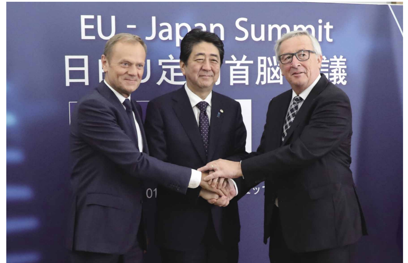
Se reunió con S.E. el Sr. Donald Tusk, presidente del Consejo Europeo, y con S.E. el Sr. Jean-Claude Juncker, presidente de la Comisión Europea, en una cumbre habitual entre Japón y la Unión Europea en Bruselas, Bélgica, y celebraron una rueda de prensa conjunta. Confirmaron que han llegado a un acuerdo sobre el Acuerdo de Asociación Económica (EPA, por sus siglas en inglés) entre Japón y la Unión Europea y el Acuerdo de Asociación Estratégica (SPA, por sus siglas en inglés) (julio de 2017).