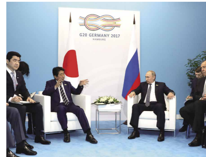
Se reunió con S.E. el Sr. Vladimir Vladimirovich Putin, presidente de la Federación Rusa, en Hamburgo, Alemania (julio de 2017).