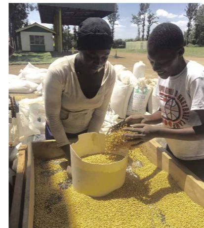
Alphajiri Ltd. toma su nombre de la palabra suajili alfajiri , que significa “amanecer”. Yakushigawa lo explica: “Elegimos el nombre para evocar la imagen de los kenianos arando los campos a primera hora de la mañana. Al empezar cada día, el nombre también me recuerda el motivo por el que vine a África y garantiza que nunca olvidaré mi propósito original”.