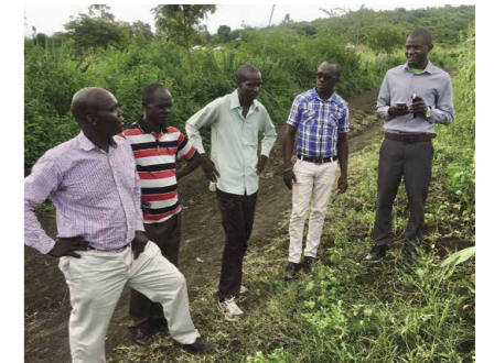
Los empleados de Alphajiri Ltd. forman directamente a los oficiales de campo que ayudan a los agricultores locales.