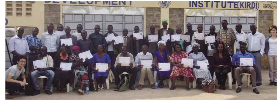
En una reunión celebrada en junio de 2017, la empresa contrató a veintitrés oficiales de campo elegidos por cada pueblo del condado de Migori.