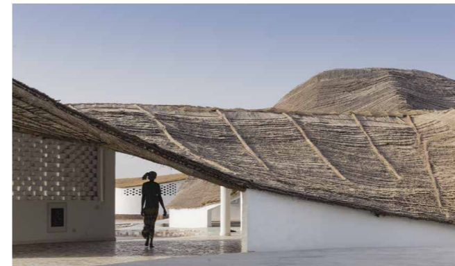
Construido con techo de paja, ladrillos de barro secados al sol y bambú, el centro se erigió con materiales y mano de obra locales. Su característica definitoria es un techo de paja inclinado que recoge la lluvia, que sirve para cubrir casi el 30 % de las necesidades domésticas de la aldea.

complejidad en ideas simples, claras y frescas", señala Mori.