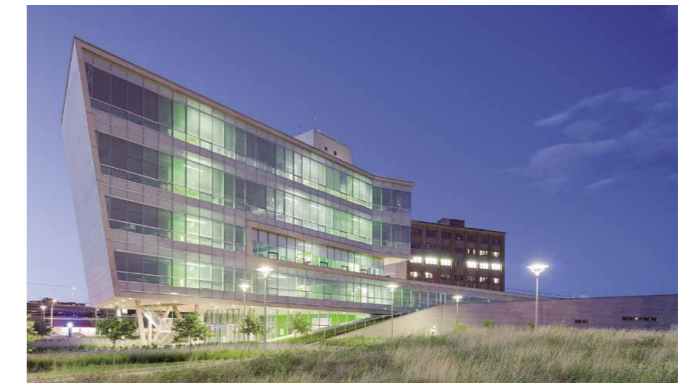
El edificio alberga una federación colaborativa de expertos en investigación ambiental, química, ingeniería, ciencia de materiales, psicología y termodinámica. Durante el proyecto se discutieron temas como las estrategias para la eficiencia energética, la calidad de los ambientes interiores y las técnicas de rehabilitación.

que anteriormente no existían. Además, señala: "Para que las mujeres participen cada vez más en el campo de la arquitectura, las industrias circundantes también deben intensificar su inclusión, por ejemplo en las industrias de la construcción, en las disciplinas de ingeniería, en el desarrollo inmobiliario y en otras importantes funciones. La arquitectura es un esfuerzo en equipo que requiere un amplio abanico de actores que toman parte. La verdadera igualdad y el progreso solo pueden lograrse si todos asumen sus respectivas responsabilidades".