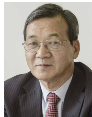
Masafumi Kuroki Director ejecutivo, Centro de Intercambio de Información del ReCAAP

La actividad que Kuroki considera de suma importancia es el intercambio de información. En este proceso, las ubicaciones de los incidentes de piratería se cuantifican por país, puerto y área marítima, y los incidentes se clasifican del nivel 1 al 4, según la gravedad. La información se comparte entre las partes contratantes y las compañías navieras a través de diversas medidas, como por ejemplo a través de alertas sobre una base ad hoc e informes periódicos. “Hay diferentes niveles de piratería y robo a mano armada contra buques, incluyendo serios crímenes organizados, como puede ser el secuestro de la tripulación, así como delitos tales como el robo de embarcaciones fondeadas. Para desarrollar contramedidas, es crucial comprender las tendencias, como por ejemplo saber qué incidentes son