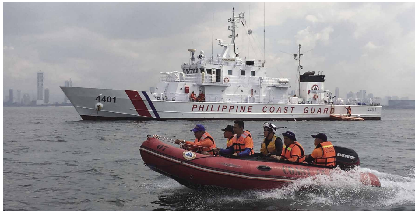
En cooperación con el Acuerdo de Cooperación Regional para Combatir la Piratería y el Robo a Mano Armada contra Buques en Asia (ReCAAP, por sus siglas en inglés) y como parte de sus medidas contra la piratería, el Gobierno japonés despacha naves patrulleras y aviones de la Guardia Costera a las naciones costeras principalmente en el Sudeste Asiático, intercambia perspectivas e información con las agencias pertinentes y lleva a cabo entrenamiento antipiratería, a la vez que coordina ejercicios marítimos. La foto muestra los ejercicios de entrenamiento de las fuerzas del orden utilizando una lancha neumática de alta velocidad para el personal de la Guardia Costera filipina (en el fondo se ve una patrullera ofrecida por Japón a la Guardia Costera filipina).

Del mismo modo que el crimen en tierra nunca desaparecerá, la piratería y el robo a mano armada contra buques en el mar aún siguen siendo problemas graves en la era moderna. Se estima que en las aguas asiáticas solía haber entre 100 y 150 incidentes al año, pero en 1999 ese número llegó a 211 y aumentó a 353 casos en el año 2000, convirtiéndose en una grave amenaza no solo en términos de seguridad, sino también en términos económicos. Los marineros japoneses corrían peligro de muerte y los barcos de otras naciones eran frecuentemente víctimas también. Para cambiar esta situación, Japón trabajó con otras naciones asiáticas para crear un nuevo marco legal, el Acuerdo de Cooperación Regional para Combatir la Piratería y el Robo a Mano Armada contra Buques en Asia (ReCAAP). Se estableció un Centro de Intercambio de Información (ISC, por sus siglas en inglés) en Singapur, que comenzó a funcionar en 2006.