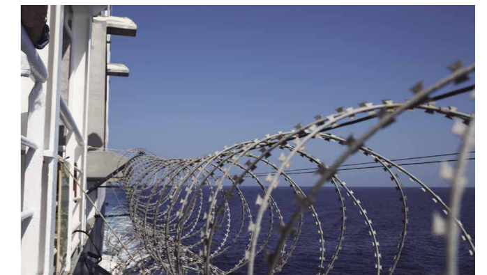
Como medidas contra los delitos en el mar, pueden resultar efectivas medidas de protección como proteger los buques con alambre de pines para dificultar su abordaje. Proporcionar asesoramiento al respecto es una de las actividades realizadas por el ISC del ReCAAP.

Con respecto a los esfuerzos mundiales para luchar contra la piratería y el robo a mano armada contra los buques, Kuroki advierte: “Es necesario estar constantemente atentos para proteger y garantizar la seguridad de los mares”. Es por eso que también es imperativo concienciarnos sobre la importancia y los resultados del ReCAAP. Continuaremos nuestros esfuerzos para aumentar el número de países contratantes y cooperantes”.