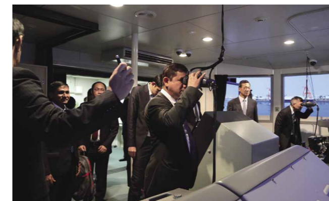
Como una de las actividades diseñadas para mejorar las capacidades de aplicación de la ley marítima, los representantes de los Estados miembros de la ASEAN, incluidas las partes contratantes del ReCAAP, fueron invitados a Singapur y Japón, y participaron en su capacitación y formación allí entre septiembre y octubre de 2017.

“La Guardia Costera de Japón fue fundada en 1948, lo que convierte su historia en una de las más largas entre las naciones asiáticas”, dice Kuroki. “Compartir sus conocimientos y experiencia acumulados para garantizar la seguridad marítima con otros países asiáticos es una forma importante de apoyar las actividades del ReCAAP. Japón se esfuerza por ayudar a otras naciones a mejorar sus capacidades proporcionando naves patrulleras en virtud de acuerdos bilaterales y enviando expertos. A medida que aumenten las capacidades de aplicación de la ley marítima de esos países, las actividades realizadas por el ISC del ReCAAP también aumentarán en efectividad”.