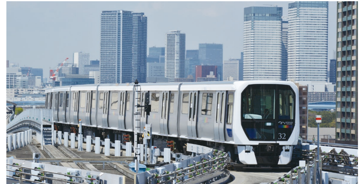
Émergeant du centre de la métropole hérissé de gratte-ciel, les trains Yurikamome traversent la baie de Tokyo sur le pont suspendu « Rainbow Bridge » et parcourent le front de mer de Rinkai, bâti sur des terres gagnées sur les eaux.

Site officiel du Yurikamome [EN] http://www.yurikamome.tokyo/