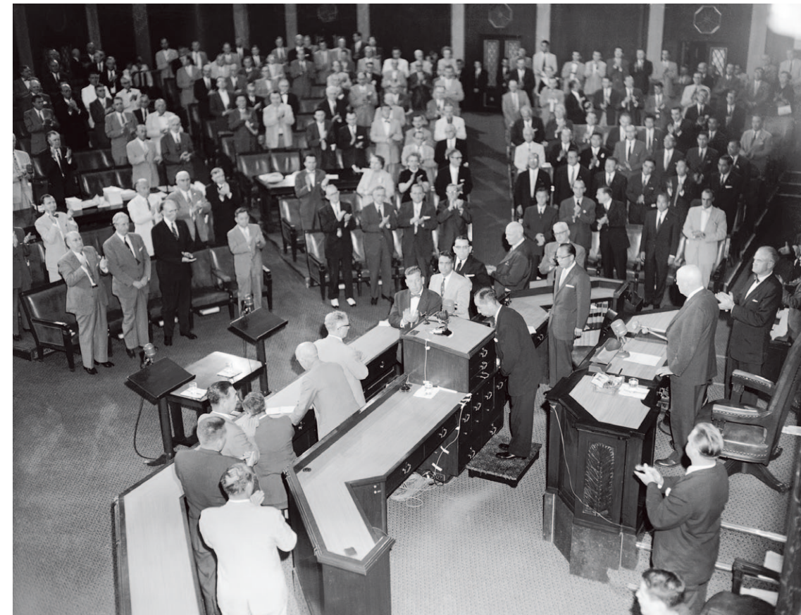
Le Premier ministre Nobusuke Kishi prononçant son discours devant le Sénat américain (juin 1957).

Depuis la fin de la guerre, en assurant sa sécurité et sa croissance économique sur la base des liens nippo-américains, le Japon jouit de la paix et de la prospérité. Une paix et une prospérité dont les fruits sont maintenant partagés dans le monde entier.