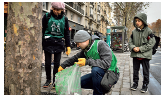
Recogiendo con esmero colillas y envoltorios de caramelos. Picados por la curiosidad, los peatones a menudo terminan entablando conversación.

de haber limpiado y ver los resultados anima mucho. Además, hacer una contribución cívica proporciona un sentimiento de satisfacción”.