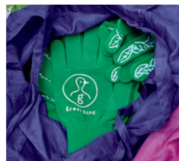
Los uniformes y los guantes a juego son enviados desde Tokio.

Nacida en Japón en 1975, vivió hasta los 2 años en Argelia y, posteriormente, de los 8 a los 17 años, en Francia. Asistió a la universidad en Japón, donde estudió culturas comparadas. Se trasladó a Francia en 2004 después de trabajar seis años en una compañía japonesa. Empezó a participar en eventos de Green Bird en 2009 y, desde 2013, es la líder del equipo parisino.