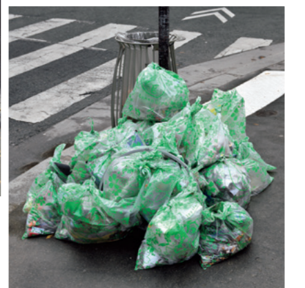
A la izquierda: Desafiando el cielo cubierto después de la lluvia, casi 40 personas se reunieron para la limpieza de noviembre. Abajo: Toda la basura recogida durante la hora se amontona en un solo lugar. Gracias a un acuerdo con la ciudad, un equipo municipal se lleva las bolsas de basura poco después.

Al equipo de París le llegan consultas de otros países. Gracias a la información que difunde, el movimiento Green Bird ha llegado a la ciudad alemana de Stuttgart, a Camerún y, con el nombre de “Action Casa”, a Marruecos. “Es estupendo ver que la energía del equipo de París ayuda a ampliar el movimiento a otros países europeos y francófonos”. Diez años después de que el movimiento nacido en Japón se estableciera en París, ha logrado volar a otros países del entorno. ✨