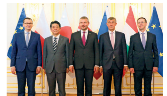
Le Premier ministre a assisté au Sommet du groupe de Visegrád (V4) plus Japon et rencontré les dirigeants des pays du V4, en Slovaquie (avril 2019).