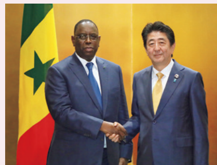
Rencontre avec S. E. M. Macky Sall, président de la République du Sénégal.