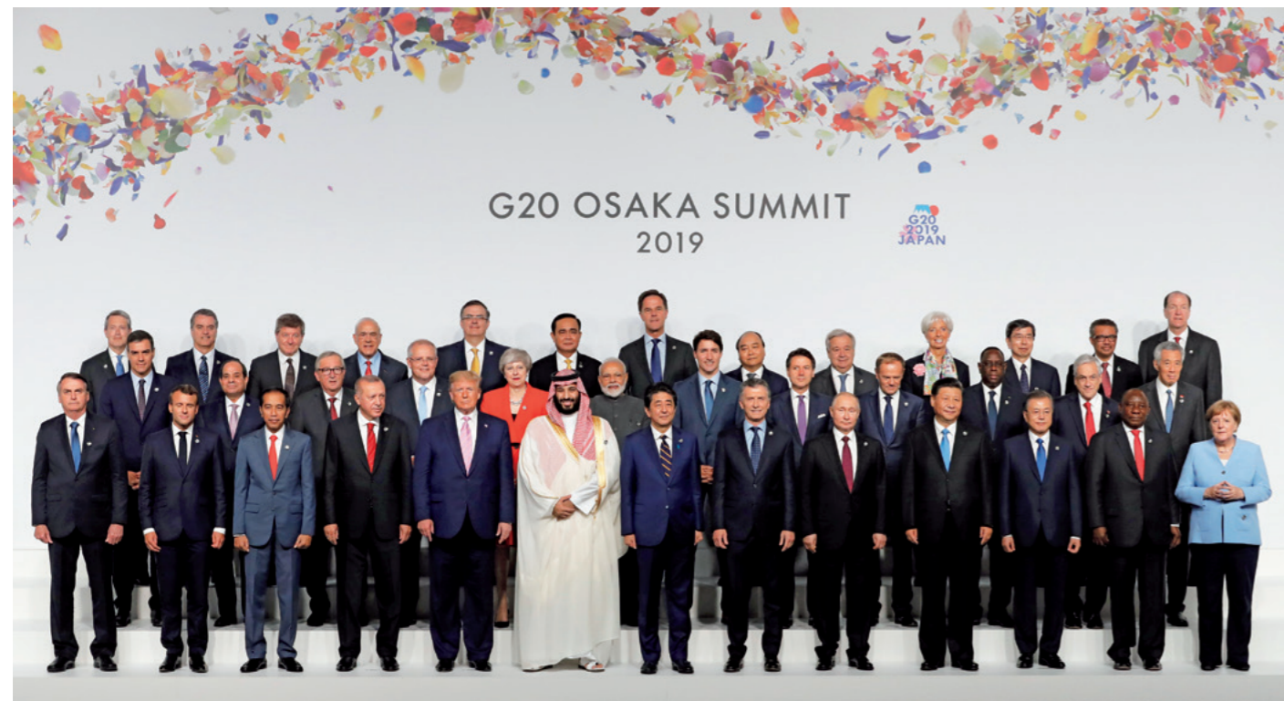
Le Premier ministre a accueilli le sommet du G20 à Osaka et rencontré les dirigeants présents (juin 2019).