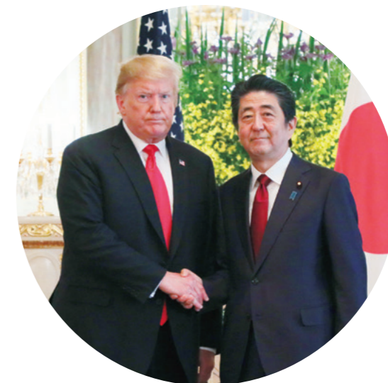
Rencontre avec M. Donald J. Trump, président des États-Unis d'Amérique, au palais d'Akasaka (mai 2019).