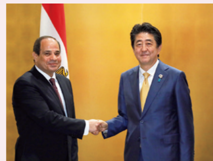
Rencontre avec S. E. M. Abdel-Fattah El-Sisi, président de la République arabe d'Égypte.