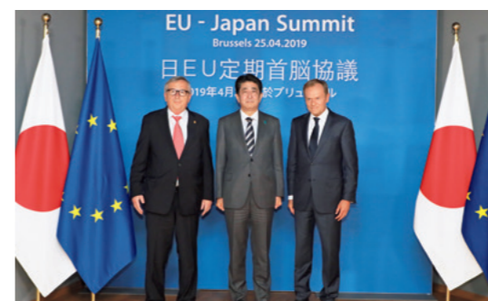
Rencontre avec S. E. M. Donald Tusk, président du Conseil européen, et S.E.M. Jean-Claude Juncker, président de la Commission européenne, en Belgique (avril 2019).