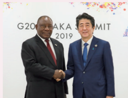
Rencontre avec S. E. M. Cyril Ramaphosa, président de la République d'Afrique du Sud.