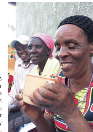
Los productores tienen pocas oportunidades de beber el café elaborado con sus granos. Este contacto con el producto final fruto de su cultivo les ayuda a entender lo que están logrando y refuerza su autoestima.