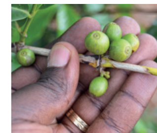
Estas frutas, llamadas cerezas de café, contienen granos que son procesados y convertidos en los granos de café que se envían a los consumidores. Los granos de café africano presentan una diversidad de características que varía según el lugar de origen.

cuando reciben altas calificaciones de acuerdo con los estándares globales.