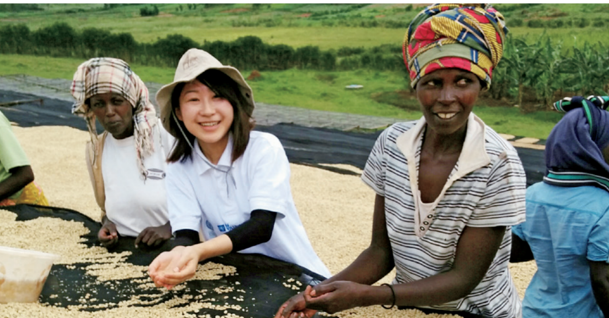
Una experta japonesa explica a los productores las diferencias entre los granos buenos y los defectuosos en una estación de lavado de café.

La Agencia de Cooperación Internacional de Japón (JICA, por sus siglas en inglés) ha puesto en marcha distintas iniciativas para apoyar el negocio del café africano. Desde 2002, la JICA impulsa pruebas de cultivo de café en Uganda, desde 2004, ofrece formación técnica en Malawi y, desde 2012, facilita su apoyo a empresas de Etiopía para la obtención de certificados internacionales y la exportación de granos certificados.