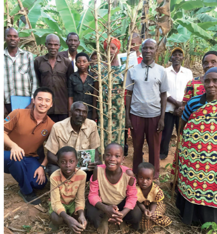
Un experto japonés con un grupo de productores. Crean confianza ofreciendo asistencia en persona in situ. Estos esfuerzos mejoran también la calidad de los granos de café.

Además, en 2016, la JICA lanzó el Proyecto para Fortalecer la Cadena de Valor del Café en Ruanda, en respuesta a una petición del Gobierno de ese país. Con dicho proyecto se pretende aumentar la conciencia en relación con los estándares de calidad entre las personas que trabajan en el sector y, al mismo tiempo, incrementar el volumen de producción y la competitividad internacional del café de Ruanda. El apoyo para introducir mejoras abarca todos los procesos: producción, selección, procesamiento, distribución y ventas. Japón envía expertos de su programa de Voluntarios Japoneses para la Cooperación Exterior para que trabajen mano a mano con el personal local.