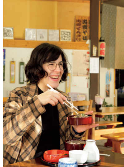
“Los fideos soba de Izumo son diferentes de los normales, pues los granos de trigo sarraceno son molidos con sus cáscaras y por ello los fideos tienen un color más oscuro y un sabor más intenso”.

son especialmente amigables y pródigas en abrazos, ¡igual que las de Río!”. Los ojos de Camila brillan cuando se refiere a su gran interés por la cultura local, en especial por los festivales de verano y el kagura , un ritual sagrado con