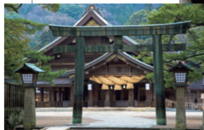
El Gran Santuario de Izumo Taisha recibe la visita de muchos turistas internacionales. “Solo con pasear a lo largo del camino que va hasta el recinto principal del santuario me siento envuelta en la pureza de su atmósfera”.

Nacida en el estado de Río de Janeiro, en Brasil, en 1991. Empezó a estudiar japonés a los 14 años. Prosiguió sus estudios de japonés en la Facultad de Literatura de la Universidad Federal de Río de Janeiro y en 2014 pasó seis meses en Japón como parte de un programa de la Japan Foundation para la formación de profesores de idioma japonés. En 2017 llegó a la ciudad de Izumo, en la prefectura de Shimane, con el programa JET.