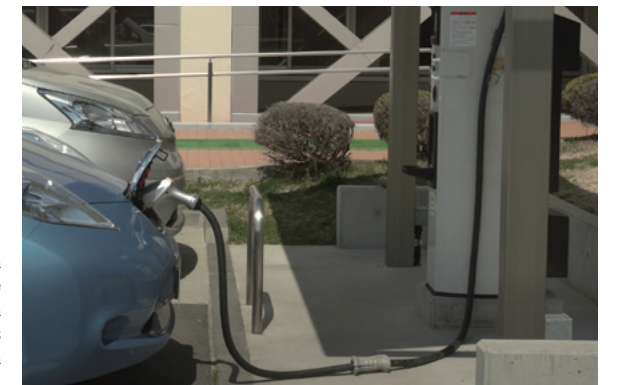
Para preservar la singular hermosura de su naturaleza, Karuizawa adopta políticas como las subvenciones a la compra de vehículos eléctricos.

Como sede de la reunión, esta localidad espera que las futuras generaciones vean ese encuentro como un punto de inflexión en relación con los problemas medioambientales del mundo. Aspira a crear el mejor entorno posible para los debates y aprovechará la ocasión para informar a los visitantes sobre las iniciativas que ha puesto en marcha. ✨