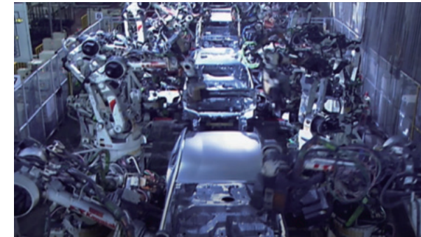
Situada cerca de la sede central de Toyota Motor Corporation, Nagoya se ha convertido en uno de los mayores centros industriales de Japón, combinando las tecnologías punta con una fuerza laboral altamente cualificada.

eventos internacionales, como la COP 10, en 2010 y la Conferencia Mundial de la UNESCO sobre la Educación para el Desarrollo Sostenible, en 2014. La reunión ministerial del G20 constituye una importante empresa a nivel de toda la región y sus residentes se unirán para ofrecer la cálida hospitalidad japonesa omotenashi a todos los invitados. La paz y la amistad son esenciales para el desarrollo global y los habitantes de Nagoya esperan que este encuentro internacional constituya una oportunidad para que las naciones líderes del mundo cooperen para garantizar el futuro de la humanidad. ✿