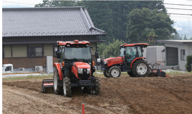
Niigata ha implementado una serie de avanzadas medidas a fin de impulsar su productividad agrícola, como el uso de tractores sin conductor.

Niigata, prefectura de Niigata | Reunión de ministros de Agricultura | 11 y 12 de mayo