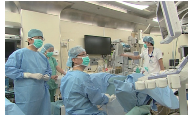
Okayama utiliza sus recursos médicos para contribuir al desarrollo de la comunidad, ayudando a que todos vivan una vida larga y saludable.

Además de servir de plataforma para mostrar su modo de abordar la salud y la asistencia médica como elementos de importancia crucial, la reunión de ministros de Sanidad permitirá a la ciudad transmitir el mensaje de que la asistencia médica debe ser ofrecida bajo la filosofía de la cobertura universal. Esto quiere decir que todos deben tener acceso a servicios de salud asequibles cuando los necesiten. *