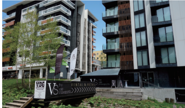
Kutchan apoya el desarrollo de edificios de apartamentos y hoteles de lujo, al tiempo que aplica rigurosos estándares estéticos.

Kutchan, prefectura de Hokkaido | Reunión de ministros de Turismo | 25 y 26 de octubre