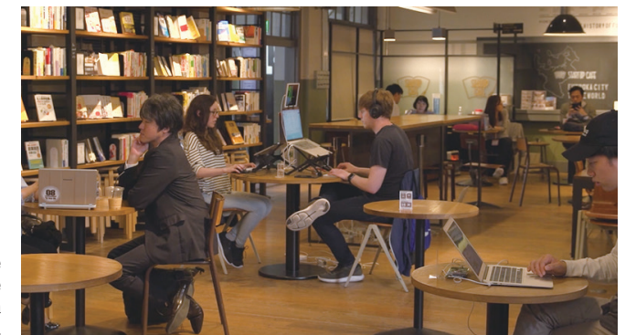
Fukuoka cuenta con uno de los mayores promotores de startups de Japón, Fukuoka Growth Next.

La innovación está llegando también al sector financiero y el mundo está prestando especial atención al desarrollo futuro de la ciudad en este ámbito, al tiempo que otorga gran importancia a la celebración de la reunión de ministros de Finanzas y gobernadores de Bancos Centrales. Como ciudad sede, Fukuoka está decidida a hacer de esta reunión un éxito. ✨