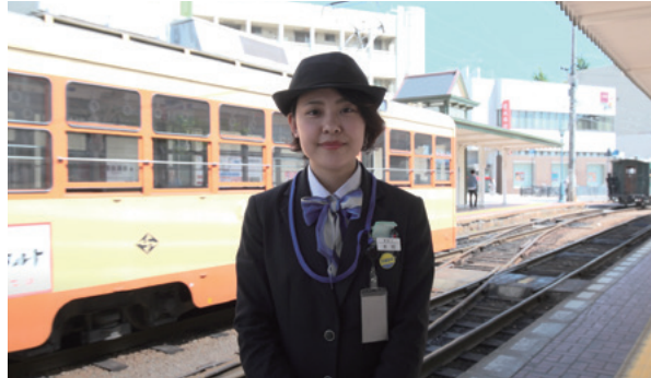
Matsuyama se esfuerza por crear una sociedad que ofrezca un ambiente laboral propicio para todos.

Matsuyama, prefectura de Ehime | Reunión de ministros de Trabajo y Empleo | 1 y 2 de septiembre