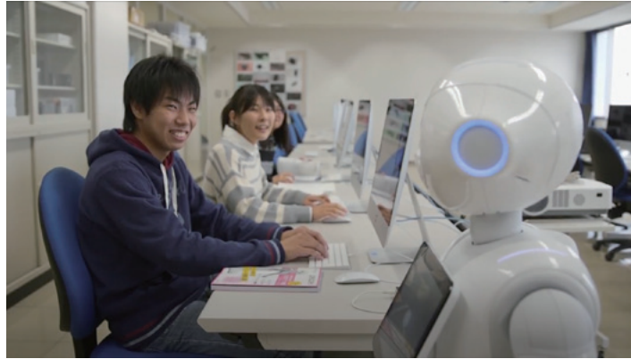
Con el uso de la robótica y la tecnología digital, Ibaraki impulsa una nueva generación de profesionales altamente cualificados.

Tsukuba, prefectura de Ibaraki | Reunión ministerial sobre Comercio y Economía Digital | 8 y 9 de junio