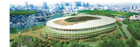
Un stade au milieu des arbres et de la végétation, en harmonie avec le climat, la nature et les traditions japonaises. (L'illustration est une représentation artistique du projet final. Le rendu de la végétation est projeté sur dix ans.)