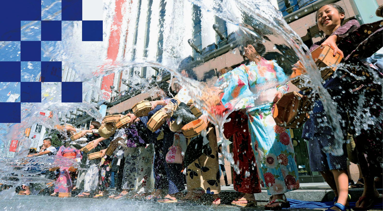
L'uchimizu, qui consiste à asperger le sol d'eau, constitue un rituel estival incontournable dans la tradition japonaise : un spectacle rafraîchissant !

TOKYO 2020 >>> Préparatifs en vue des Jeux olympiques et paralympiques