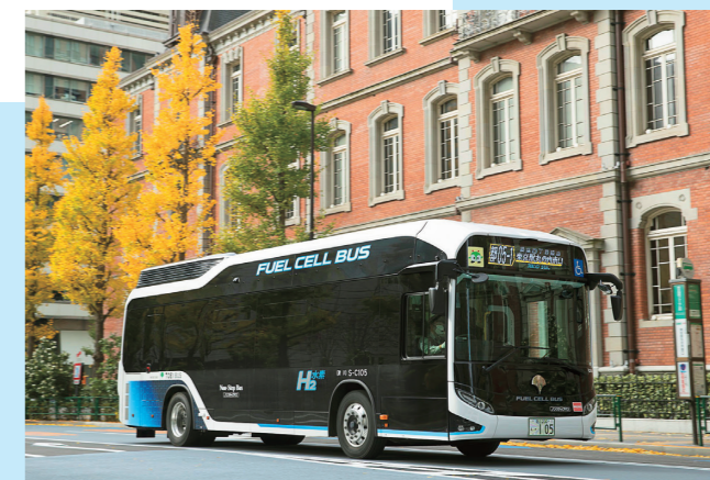
L'augmentation du nombre de stations a entraîné la multiplication des voitures, bus et autres véhicules à hydrogène. Des projets sont en cours pour mettre en fonctionnement une centaine de bus à hydrogène à Tokyo et dans d'autres villes d'ici 2020.