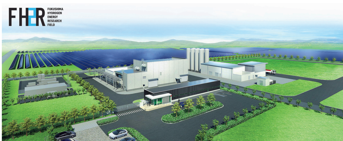
Représentation en 3D du centre de recherche pour l'hydrogène de Fukushima (FH2R). Cet établissement est une étape majeure vers la mise en place d'une société fonctionnant à l'hydrogène.

DOSSIER >>> Une innovation continue au service des ODD