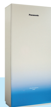
Panasonic prévoit de commercialiser une pile à combustible fonctionnant entièrement à l'hydrogène d'ici l'année 2021. Ce nouveau produit est encore plus propre, car il génère de l'électricité directement à partir d'hydrogène fourni par les stations, sans utiliser de gaz de ville. Ces applications pourraient bénéficier aux usines, aux établissements commerciaux et aux immeubles résidentiels.

la « fabrication » à l'« utilisation » en passant par le « stockage ». La gestion des fluctuations de l'alimentation électrique produite à partir d'énergies renouvelables constitue un enjeu particulièrement délicat car elle est dépendante des conditions météorologiques et d'autres facteurs extérieurs. Ce problème sera étudié au moyen de tests de vérifications menés par le FH2R. Celui-ci représente la plus importante installation au monde