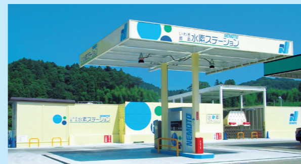
Une station d'hydrogène à Iwaki, dans la préfecture de Fukushima. Elle fait partie des 109 stations existant actuellement sur l'Archipel.