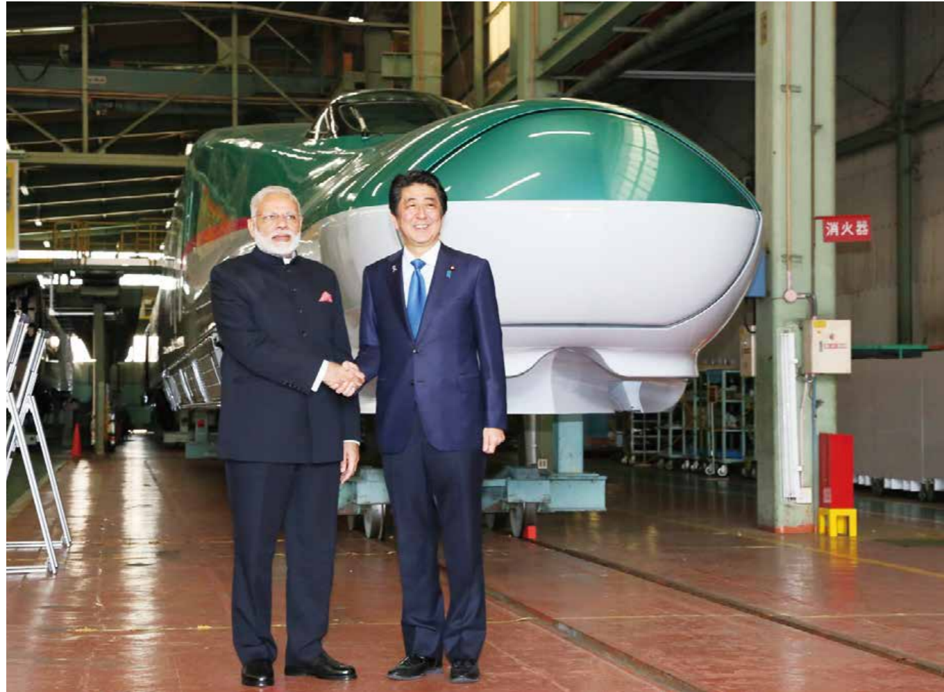
Los primeros ministros Shinzo Abe y Narendra Modi realizan un recorrido por la planta de Kawasaki Heavy Industries para la fabricación de trenes Shinkansen de Hyogo en Kobe, Japón, el 12 de noviembre de 2016.

El PIB de la India, un vasto país inmerso en un rápido crecimiento económico, se disparó más del 6 % durante 2017. Esto se suma a un aumento de la población de más del 13 % durante los últimos 10 años. Como era de esperar, debido a este éxito, India se enfrenta a desafíos demográficos sin precedentes.