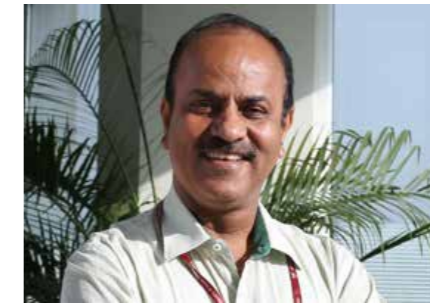
Achal Khare Director general de National High Speed Rail Corporation Ltd. Ha estado trabajando en la amplia red ferroviaria de la India durante más de 34 años.