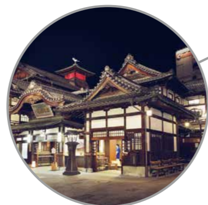
Reunión de ministros de Trabajo y Empleo Matsuyama, prefectura de Ehime