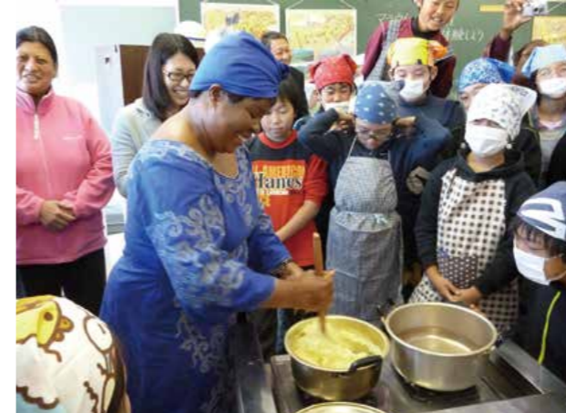
Estudiantes de educación primaria de la ciudad de Yokohama aprenden sobre la comida de Malawi como parte del proyecto “Una escuela, un país”.

Yokohama ha sido seleccionada como ciudad anfitriona de la Séptima Conferencia Internacional de Tokio sobre el Desarrollo de África (TICAD7, por sus siglas en inglés), que se celebrará en Japón en 2019. La TICAD es una conferencia internacional sobre el desarrollo de África, dirigida por el Gobierno de Japón, en cooperación con las Naciones Unidas, el Programa de las Naciones Unidas para el Desarrollo (PNUD), el Banco Mundial y la Comisión de la Unión Africana. Entre sus participantes se encuentran líderes de naciones africanas y representantes de organizaciones internacionales.