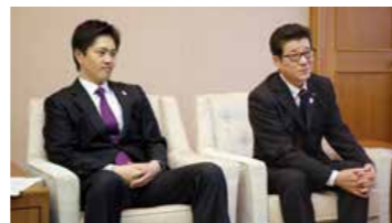
Ichirō Matsui (derecha), gobernador de la prefectura de Osaka

Nació en la prefectura de Osaka en 1964. Fue miembro de la Asamblea Prefectural de Osaka. Fue elegido gobernador de la prefectura de Osaka en 2011.