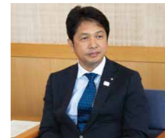
Kazuhiko Ōgawa, gobernador de la prefectura de Ibaraki

Nació en Tsuchiura, prefectura de Ibaraki, en 1964. Se incorporó en 1988 al Ministerio de Comercio Internacional e Industria (actual Ministerio de Economía, Comercio e Industria). Dejó el ministerio en 2003 y desempeñó la posición de director de DWANGO Co., Ltd., antes de asumir el cargo de gobernador de la prefectura de Ibaraki en septiembre de 2017.