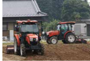
Niigata implementa varias avanzadas medidas para aumentar su productividad agrícola, como es el uso de tractores sin conductor. KUBOTA Corporation

Niigata también trabaja arduamente para lograr una agricultura de vanguardia con el uso de fábricas de plantas a gran escala y la incorporación de la tecnología de la información y la comunicación. “Quiero que nuestros visitantes de la reunión de ministros de Agricultura vean nuestra agricultura con visión de futuro, así como nuestros esfuerzos por crear una nueva cultura alimentaria, por ejemplo, ayudando a poner en marcha restaurantes operados por familias