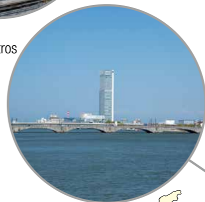
Reunión de ministros de Agricultura Niigata, prefectura de Niigata