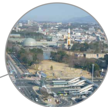
Reunión ministerial sobre Comercio y Economía Digital Tsukuba, prefectura de Ibaraki