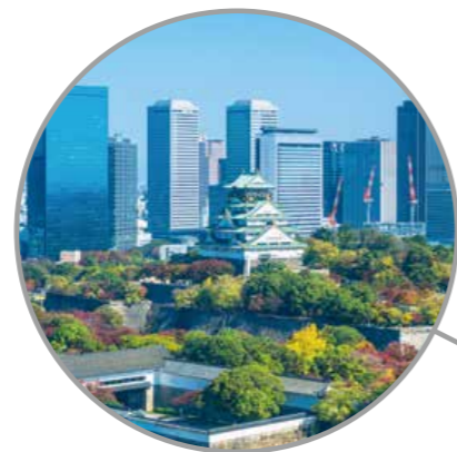
Reunión Cumbre del G20 Osaka, prefectura de Osaka

Durante el año en que se organiza también se celebran reuniones ministeriales en las que se debaten temas relacionados.