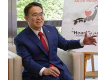
Hideaki Ōmura, gobernador de la prefectura de Aichi

Nació en la prefectura de Aichi en 1960. Fue elegido por primera vez como miembro de la Cámara de Representantes en 1996. Fue viceministro de Economía, Comercio e Industria y viceministro de la Oficina del Gabinete. Asumió el cargo de gobernador de la prefectura de Aichi en 2011.