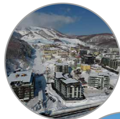
Reunión de ministros de Turismo Kutchan, prefectura de Hokkaidō