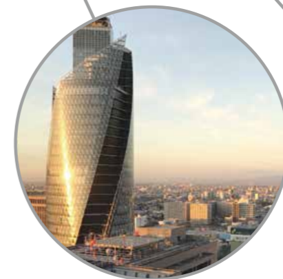
Reunión de ministros de Asuntos Exteriores Nagoya, prefectura de Aichi