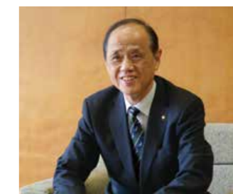
Masao Ōmori, alcalde de Okayama

Nació en Okayama, prefectura de Okayama, en 1954. Fue director general de Gestión de Desastres de la Oficina del Gabinete y director general de la Oficina Nacional de Planificación Territorial y Política Regional del Ministerio de Tierra, Infraestructura, Transporte y Turismo. Se convirtió en alcalde de Okayama en octubre de 2013.