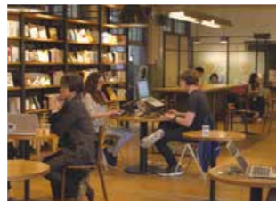
Fukuoka cuenta con una de las mayores aceleradoras de startups de Japón, Fukuoka Growth Next.

“En la zona especial, el Gobierno ofrece reducciones fiscales en los impuestos corporativos y flexibiliza los requisitos de visados para los nuevos empresarios”, explica el alcalde de Fukuoka, Sōichirō Takashima. “Junto con el apoyo de la aceleradora de startups (empresas emergentes) de Fukuoka, Fukuoka Growth Next, la aceleradora más grande de Japón, la ciudad ha atraído a destacados recursos humanos de todo Japón y del extranjero, y es el origen de muchas empresas excepcionales. Se podría decir que Fukuoka es la ciudad más amigable para las startups de Japón”. Se están llevando a cabo dentro de la ciudad experimentos para el uso de drones y energía de hidrógeno, así como en las implementaciones de tecnologías como la inteligencia artificial y el Internet de las Cosas también están avanzando.