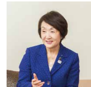
Fumiko Hayashi, alcaldesa de Yokohama

Nació en Tokio en 1946. Fue presidenta de BMW Tokyo Corp. y presidenta ejecutiva de The Dai-ichi, Inc. Se convirtió en alcaldesa de la ciudad de Yokohama en 2009.