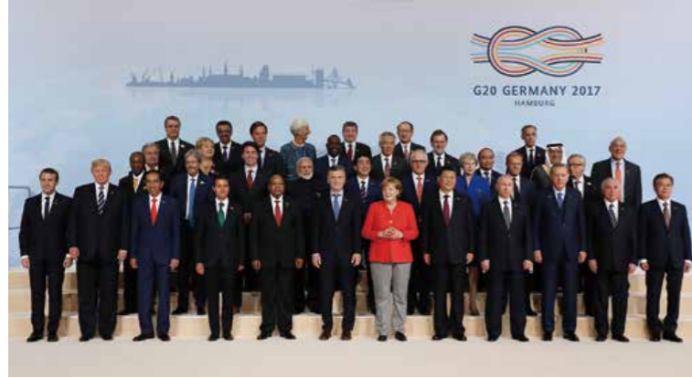
La Cumbre del G20 en Hamburgo se celebró los días 7 y 8 de julio de 2017 en Alemania. La Cumbre del G20 en Buenos Aires se celebrará del 30 de noviembre al 1 de diciembre de 2018 en Argentina.

Las nueve ciudades anfitrionas de la Cumbre del G20 y sus reuniones ministeriales relacionadas tienen su propia y fascinante gastronomía, historia y cultura. La ciudad de Osaka, sede de la Cumbre, es uno de los motores económicos de Japón con una población de 2,72 millones de habitantes (prefectura de Osaka: 8,83 millones) y un PIB de 20 billones de yenes (187.000 millones de dólares estadounidenses) (prefectura de Osaka: 39 billones de yenes [364.000 millones de dólares]). Mientras tanto, la reunión de ministros de Turismo se celebrará en la cada vez más popular y pintoresca ciudad turística internacional de Kutchan, Hokkaidō, con una población de 16.000 habitantes. Estos municipios increíblemente diversos ya han empezado a prepararse a fondo para las reuniones que acogerán. El siguiente artículo muestra las atractivas cualidades de cada una de las sedes y las expectativas de sus líderes.