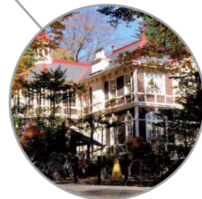
Reunión ministerial sobre Transiciones Energéticas y Medio Ambiente Mundial para el Desarrollo Sostenible Karuizawa, prefectura de Nagano