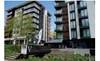
Kutchan promueve el desarrollo de condominios y hoteles de lujo, al tiempo que hace cumplir estrictas normas medioambientales.

Nació en Hokkaidō en 1963. Se convirtió en alcalde en 2015, tras desempeñar como gerente de la Sección de Construcción de Kutchan y en otros puestos.