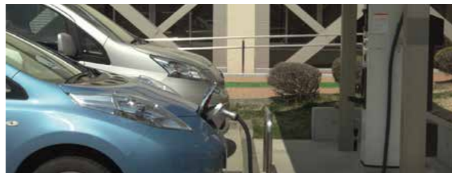
Con el fin de preservar su singular belleza natural, Karuzawa adopta políticas tales como son las ayudas para la compra de vehículos eléctricos.

y deseamos crear el mejor ambiente posible para un debate productivo, a la vez que informamos a nuestros visitantes sobre los esfuerzos de nuestra ciudad”.