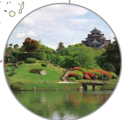
Reunión de ministros de Sanidad Okayama, prefectura de Okayama