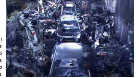
Aichi, sede de Toyota Motor Corporation, se ha convertido en uno de los mayores centros industriales de Japón con su tecnología de vanguardia y una mano de obra altamente cualificada.

La prefectura de Aichi ha acogido con éxito varios eventos y reuniones internacionales, incluyendo la Exposición Universal de 2005. El gobernador Ōmura explica las esperanzas de sus conciudadanos para la