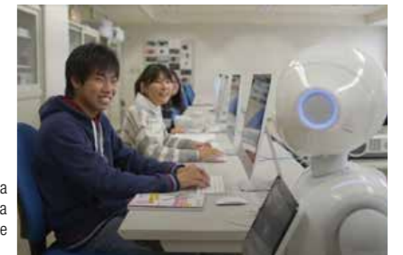
Ibaraki se dedica al uso de la robótica y la tecnología digital para educar a su próxima generación de profesionales cualificados.

El gobernador de la prefectura de Ibaraki, Kazuhiko Ōgawa, explica: “Estamos aprovechando las condiciones favorables de Ibaraki para dedicar esfuerzos que van por delante de otras prefecturas con el fin de impulsar aún más nuestra industria y cultivar futuros líderes”. Ejemplos de estos esfuerzos incluyen las ideas de Ibaraki para resolver problemas sociales mediante el uso de tecnologías digitales innovadoras como son la conducción autónoma y la robótica, así como el fomento de los recursos humanos con la ayuda de equipos digitales.