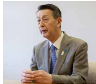
Akira Shinoda, alcalde de Niigata Nació en la ciudad de Niigata en 1948. Trabajó para una compañía de periódicos. Fue elegido alcalde de Niigata en 2002.

agricultoras. También espero que disfruten de nuestra cocina japonesa, del sake y de la cultura de las geishas ”.