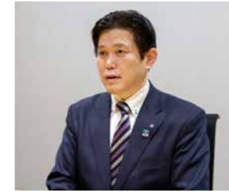
Eiji Nishie, alcalde de Kutchan

La ciudad ha trabajado duro para hacer la vida más fácil a los visitantes no japoneses, incluyendo la prestación de servicios en diversos idiomas en su hospital general. Debido a que el turismo es una industria altamente estacional, Kutchan también ha implementado medidas para atraer convenciones durante la temporada baja y convertirse en un