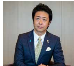
Sōichirō Takashima, alcalde de Fukuoka

Nació en la prefectura de Ōita en 1974. Trabajó como presentador de televisión. Fue elegido alcalde de Fukuoka en 2010, a la edad de 36 años.