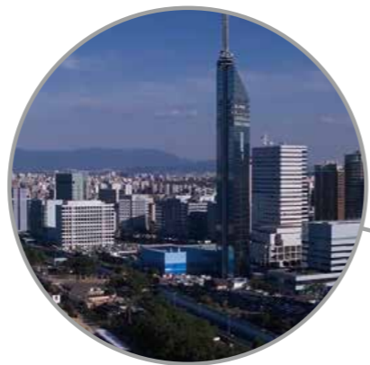
Reunión de ministros de Finanzas y gobernadores de los bancos centrales Fukuoka, prefectura de Fukuoka