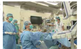
Okayama aprovecha sus abundantes recursos médicos para el desarrollo de la comunidad que permite a todos vivir una vida larga y saludable.

El alcalde Ōmori continúa diciendo: “A través de la reunión de ministros de Sanidad, esperamos transmitir el enfoque de Okayama sobre la salud y la atención médica