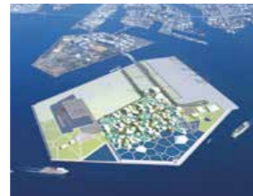
Como candidata a ser sede de la Exposición Universal de 2025, Osaka continúa transformándose para convertirse en una ciudad verdaderamente internacional. MINISTRY OF ECONOMY, TRADE AND INDUSTRY

El alcalde de la ciudad de Osaka, Hirofumi Yoshimura, también está deseando que llegue la Cumbre. “Estamos tomando todas las precauciones posibles para la seguridad de esta Cumbre mundial de alto nivel, la cual reunirá a unas 30.000 personas. Quiero hacer del éxito de la Cumbre del G20 una oportunidad para que Osaka crezca y represente a Japón junto a Tokio”.