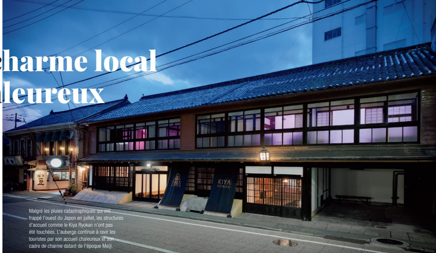
Malgré les pluies catastrophiques qui ont frappé l'ouest du Japon en juillet, les structures d'accueil comme le Kiya Ryokan n'ont pas été touchées. L'auberge continue à ravir les touristes par son accueil chaleureux et son cadre de charme datant de l'époque Meiji.