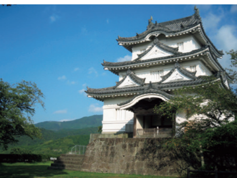
Le château d'Uwajima, construit en 1601, compte parmi les douze châteaux du Japon qui demeurent sous leur forme d'origine.

kun », apprécient ses propositions originales. « Il est devenu difficile d'imaginer Uwajima sans Baru-kun », disent-ils. Une chose est certaine : ce jeune-homme passionné va continuer à se faire l'ambassadeur de la ville, avec le cœur empli de cette hospitalité chaleureuse qui le touche tant. « Uwajima a subi des dégâts pendant les pluies torrentielles de juillet, mais heureusement, la ville a repris le dessus », précise-t-il, et de s'empresser d'ajouter : « Le ryokan vous accueillera avec son hospitalité habituelle — vous pourriez être le prochain visiteur ! » ✨