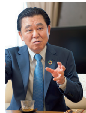
Masashi Mori est né à Toyama en 1952, et a été élu membre de l'Assemblée préfectorale de Toyama en 1995. En 2002, il a été élu maire de la ville.

S' 'étendant sur 1 242 kilomètres carrés depuis la côte de la Mer du Japon jusqu'aux montagnes, Toyama est la capitale de la préfecture du même nom. Forte d'une population de 420 000 habitants, c'est une ville de province de taille moyenne, qui, comme beaucoup d'autres agglomérations au Japon, connaît un vieillissement rapide de la société. Sa longue expérience de la situation l'a amenée à devenir un exemple pour le monde entier.