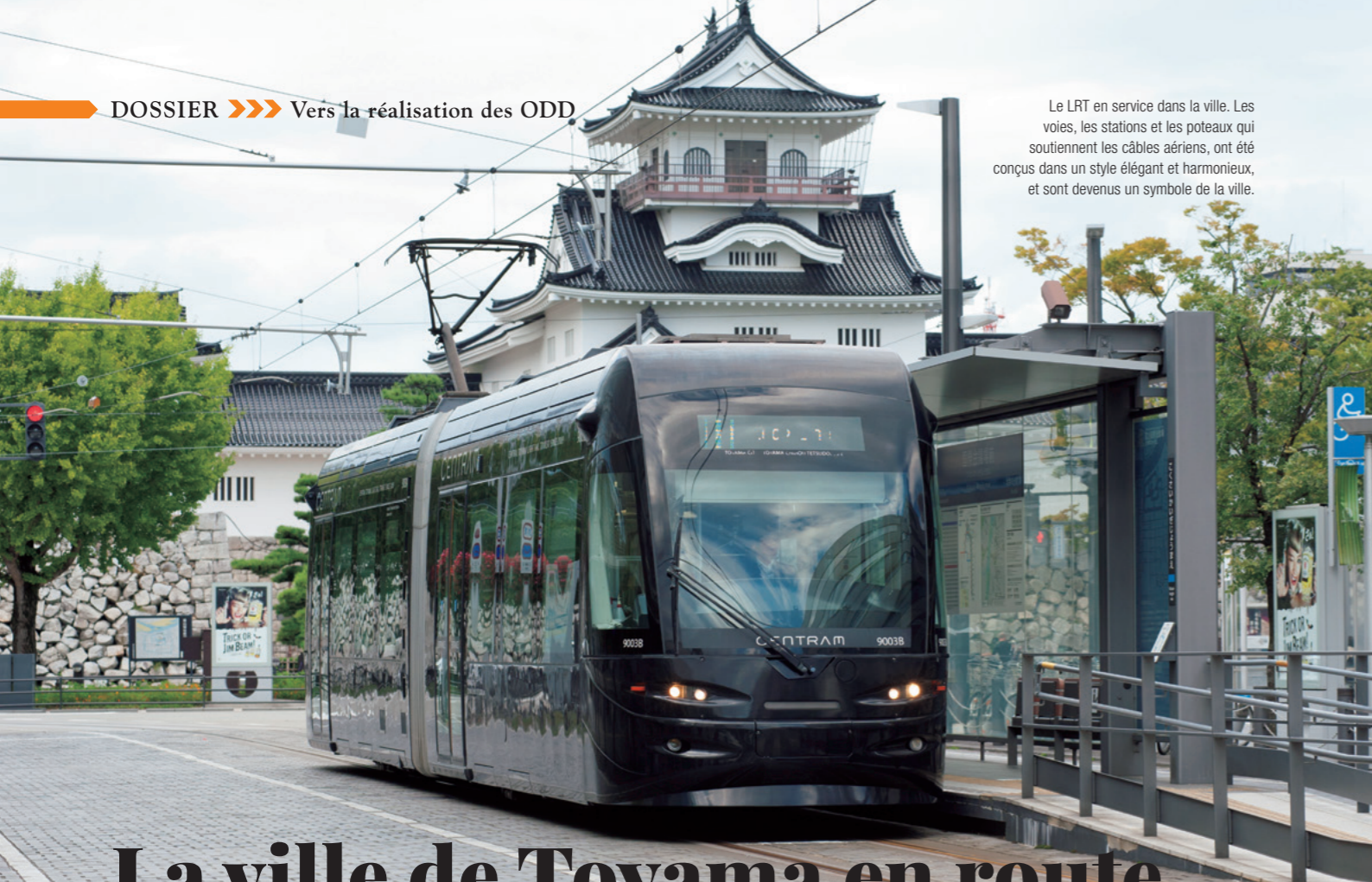
Le LRT en service dans la ville. Les voies, les stations et les poteaux qui soutiennent les câbles aériens, ont été conçus dans un style élégant et harmonieux, et sont devenus un symbole de la ville.