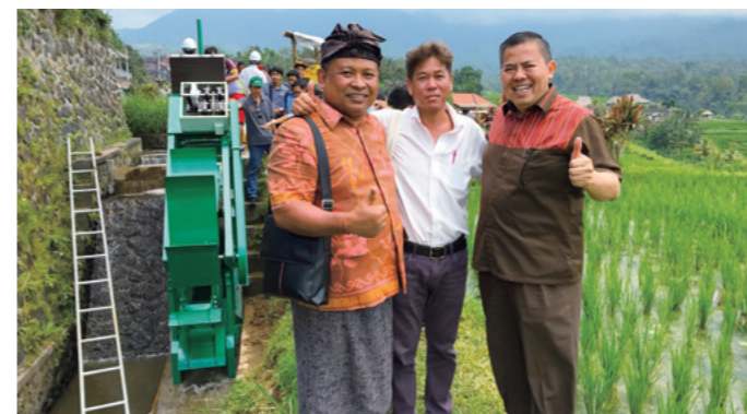
De nombreux employés ont été dépêchés en Indonésie, pour apporter une assistance technologique, assurant les fonctions combinées du gouvernement local et de l'entreprise.