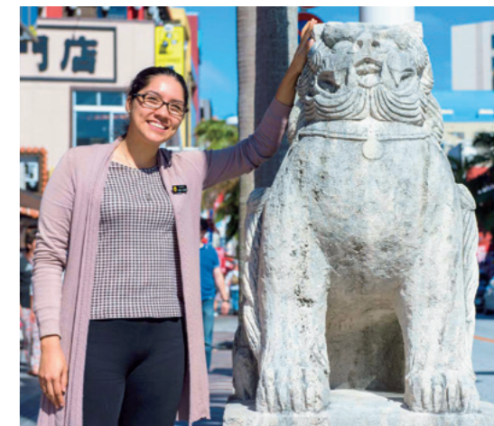
Derecha: Kokusai Dori está a solo unos pasos de la oficina de la prefectura de Okinawa y, aún entre semana, está siempre llena de turistas. Es uno de sus lugares favoritos.