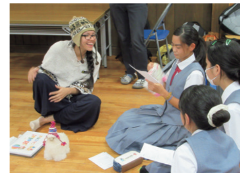
Centro: Ataviada con el traje típico peruano les habla a unas niñas sobre el Perú.