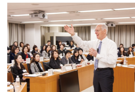
1 | 2 | 3

Aprender debatiendo métodos para analizar las economías de varios países, los mecanismos que desencadenan las crisis financieras y el impacto de las políticas gubernamentales sobre las economías.