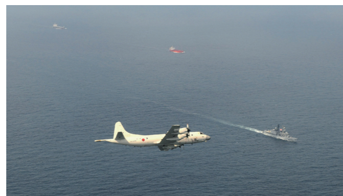
Японский корабль сопровождения «Хамагири» и патрульный самолет P-3C выполняют миссию защиты в Аденском заливе.

Сомали и Аденский залив – стратегический район международных морских перевозок, связывающих Восточную Азию и Европу; ежегодно через Аденский залив проходит около 17 тысяч судов. Примерно с 2008 г. на этом важном морском участке резко участились вылазки пиратов, захватывающих торговые суда с целью выкупа. Это отчасти объясняется обострением политической ситуации в Сомали. Учитывая чрезвычайную важность обеспечения безопасности морских перевозок, необходимых для внешней торговли, Япония в 2009 г. направила туда корабли сопровождения и патрульные самолеты для охраны торговых судов и борьбы с пиратами в качестве посильного вклада в международное сотрудничество по пресечению пиратства в открытом море. Защита распространяется на торговые суда любых стран; всего за 8 лет защиту получили около 3900 судов.