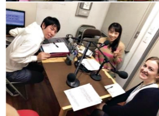
1 2 3