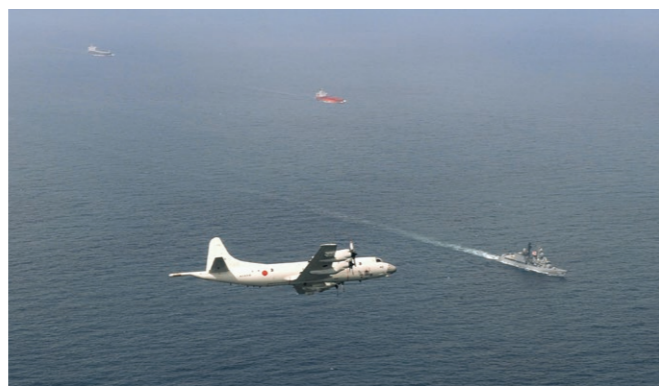
Le destroyer japonais Hamagiri et un patrouilleur P-3C en mission d'escorte dans le golfe d'Aden.

Le golfe d'Aden au large des côtes de la Somalie constitue un environnement très hostile, avec des températures qui atteignent 50 °C dans la journée. Dans ces conditions extrêmes, les membres des unités déployées restent constamment en