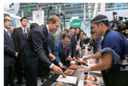
Министр промышленности и торговли Денис Мантуров посетил стенд, рекламирующий японские продукты питания, и попробовал сасими.