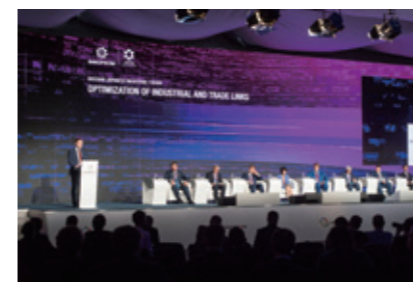
Лидеры отраслей японской и российской промышленности обсудили текущее состояние и будущее развитие экономического сотрудничества между двумя странами на японско-российском промышленном форуме.