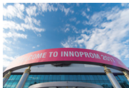
Крупнейшая в России торгово-промышленная выставка, основное внимание на которой уделяется таким вопросам, как машинное оборудование, производство комплектующих, информационные технологии, энергетика и градостроение, ежегодно проводится в июле. Число посетителей на протяжении четырех дней достигло 50 194 чел. (на основании предоставленного организатором отчета о выданных посетителям бейджках).

компаний и организаций приняли участие в работе «Павильона Японии», второго по количеству участников после принимающей страны. Кроме того, состоялся японско-российский промышленный форум с повесткой «Японско-российское сотрудничество и его роль в оптимизации промышленности», на котором лидеры отраслей японской и российской промышленности подчеркнули важность совместной работы. Многие руководители японских и российских промышленных кругов также присоединились к участникам круглых столов по таким темам, как малый бизнес и повышение производительности, где они приняли участие в оживленном обмене мнениями и идеями.