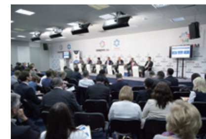
Были организованы различные круглые столы. За одним из них рассматривались возможности сотрудничества между японскими и российскими малыми предприятиями.