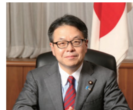
Хиросигэ Сэко, министр экономики, торговли и промышленности и министр по экономическому сотрудничеству с Россией

Таким образом, экономические связи между Японией и Россией кардинально укрепились благодаря этим событиям, которые происходят как результат стабильных доверительных отношений между Премьер-министром Абэ и Президентом Путиным. Как глава министерства я обязуюсь посвятить себя продвижению истинного партнерства между двумя нашими народами, продолжая создавать положительные тенденции по линии бизнеса и государственных органов путем реализации этого плана сотрудничества.