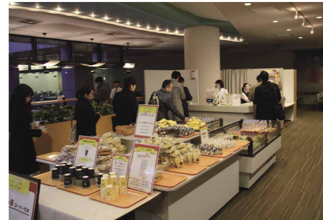
Itochu Corporation a introduit en 2013 un système de travail axé sur le matin. Les heures travaillées entre 5 h et 8 h du matin sont payées au même niveau que les heures supplémentaires du soir. Le petit déjeuner est également gratuit pour les employés qui commencent à travailler avant 8 h. Depuis l'introduction de ce système, les longues heures supplémentaires, qui étaient l'un des facteurs empêchant une participation active des femmes dans le monde du travail, ont considérablement diminué, alors que le revenu net a augmenté.

La croissance économique à travers la participation des femmes dans le monde du travail - autrement dit, les « womenomics » - a été l'une des priorités du gouvernement depuis que le Premier ministre Abe a pris ses fonctions en 2012. Le Premier ministre a déclaré : « Les femmes apportent à la gestion des entreprises certaines perspectives que seules celles-ci sont en mesure d'apporter. Les organisations diversifiées sont