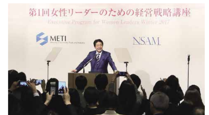
Le Premier ministre Abe a participé à une réception pour « Executive Program for Women Leaders », un séminaire organisé par le gouvernement en coopération avec le secteur privé afin de promouvoir la gestion stratégique, le leadership et autres capacités déterminantes chez les femmes chefs d'entreprise ou cadres de haut niveau. Il a déclaré que le Japon vise à un accroissement du nombre de femmes administrateurs en tant que politique économique, et non pas en tant que politique sociale, et que cela permettra au Japon de réaliser une nouvelle croissance (janvier 2017).