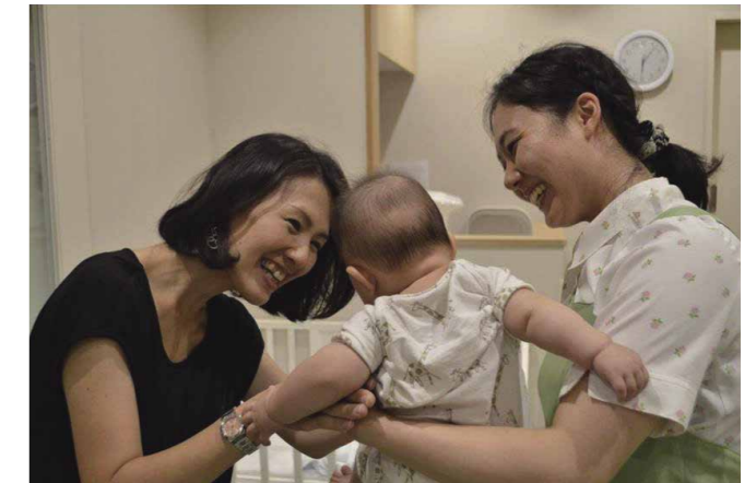
En 2010, Itochu Corporation a introduit « I-Kids », une crèche destinée aux employés et située à proximité de son siège de Tokyo. L'entreprise répond ainsi aux évolutions de l'environnement social, y compris l'augmentation du nombre d'employés femmes et celle du nombre de couples dans lesquels le mari et la femme travaillent.

« La raison pour laquelle la diversité est importante est que de nouvelles idées et valeurs apparaissent lorsque des gens avec des expériences différentes se rassemblent, et cela améliore les choses », poursuit-elle. « Le fait d'être une femme contribue dans la pratique à la diversité sociale. Via son visa start-up, un système à points destiné aux professionnels hautement qualifiés, ainsi que d'autres mesures, le gouvernement japonais prépare aujourd'hui un environnement dans lequel les non-Japonais n'éprouvent pas de difficultés à travailler au Japon. Je pense que le plus grand bénéfice de tous ces efforts est que cela va introduire une diversité d'expériences au Japon. Lorsque nous cataloguons les gens en hommes, femmes, étrangers ou personnes âgées, il devient difficile de mettre en valeur les capacités et les idées que chacun possède. Un environnement dans lequel les gens sont tous capables de mettre en avant leurs