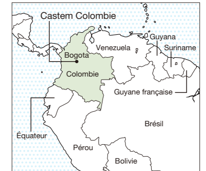
L'usine de Castem en Colombie se trouve dans la zone franche industrielle Intexzona, à proximité de l'aéroport international El Dorado de Bogota. Elle a été conçue par un architecte local, en accord avec les idées de Takuo Toda, le PDG de Castem, pour qui une entreprise doit soigner son apparence si elle veut attirer du personnel de haut niveau.