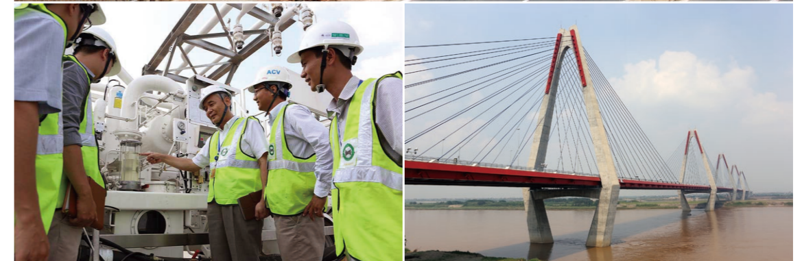
1. Edificio de la Terminal 2 del Aeropuerto Internacional Noi Bai, en Hanoi. Se espera que la ampliación del aeropuerto contribuirá al desarrollo de Vietnam como destino turístico y como centro de conexión logístico. 2. Construcción del edificio de la Terminal 2. El coste de construcción total fue de 76.100 millones de yenes (725 millones de dólares estadounidenses), de los cuales un 78 % fue cubierto por créditos de la AOD de Japón. 3. Pilones de bello diseño sustentan el puente Nhat Tan, que tiene una longitud total de 3.755 metros. El costo de construcción total fue de 75.000 millones de yenes (714 millones de dólares estadounidenses), de los cuales un 72 % fue cubierto por créditos de la AOD de Japón. El puente, conocido también como puente de la Amistad Vietnam-Japón, es un símbolo de los afectuosos lazos que unen a ambas naciones.