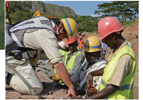
1. Vista aérea del nuevo Puente Internacional de Rusumo y del complejo de Puesto Fronterizo de Parada Única (OSBP). A la izquierda se ve el emplazamiento del OSBP, en la orilla tanzana del río. 2. El panel conmemorativo a la entrada del puente muestra la bandera japonesa junto a las de Ruanda y Tanzania. Alumnos de arquitectura de una universidad local visitaron varias veces el sitio de construcción para conocer los métodos de erección utilizados por los japoneses. 3. Un ingeniero de una constructora japonesa (izquierda) ofrece indicaciones a ingenieros locales durante las obras del proyecto.