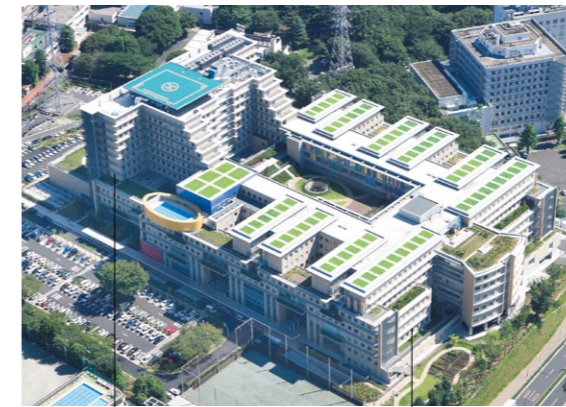
Centro Médico de Tama

Los dos centros médicos con las instalaciones de mayor escala de Tokio