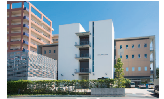
1. L'arrondissement d'Ota, situé à la pointe sud de la zone des 23 arrondissements qui constitue le cœur de Tokyo, abrite depuis longtemps une concentration de petits ateliers qui ont contribué au développement économique du Japon. L'étape suivante consiste aujourd'hui pour Ota à renforcer encore son secteur manufacturier, en mettant à profit la multiplication des vols internationaux à destination et en partance de l'aéroport de Haneda. 2. Ota Techno Core : cet « appartement usine » entouré d'un extérieur soigné abrite des ateliers où travaillent des mécaniciens experts.