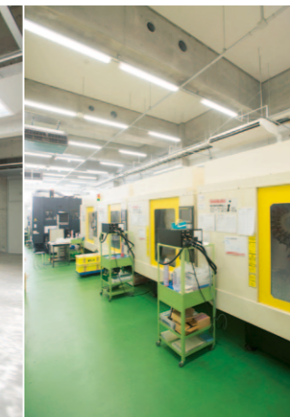
3 | 4