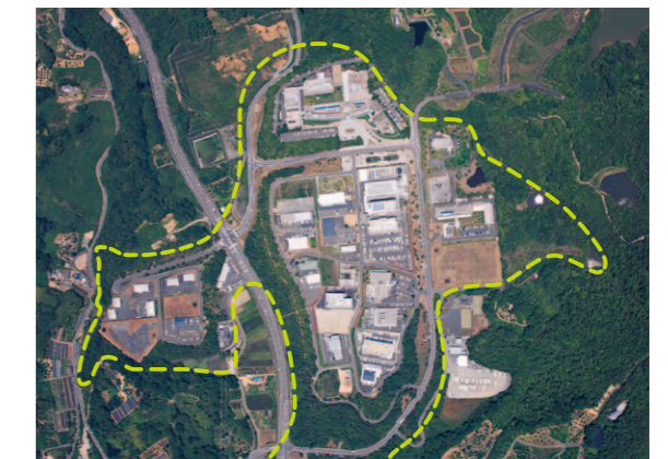
Okayama Research Park es un nuevo polígono industrial concebido para elevar el nivel industrial de la prefectura y el valor agregado de los productos. El Gobierno planea establecer otros polígonos similares, promover esfuerzos estratégicos para atraer negocios y traer las mejores empresas a la zona. Durante el pasado año fiscal se han invertido en acondicionamiento de suelos industriales 68.000 millones de yenes (unos 567 millones de dólares). Se espera que se creen 900 puestos de trabajo.