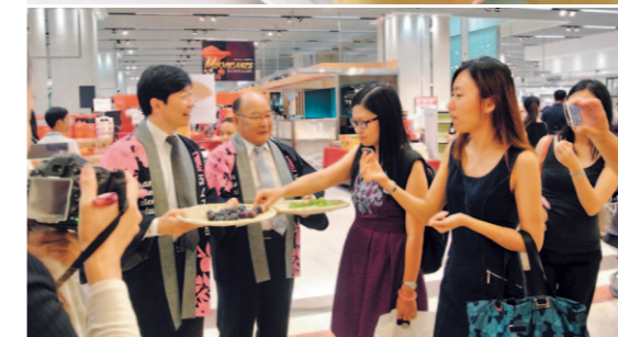
La prefectura organiza ferias de Okayama, principalmente en lugares de Asia como Hong Kong, Taiwán, Singapur, Malasia e Indonesia donde promueve activamente los melocotones blancos de Shimizu, la uva moscatel, y otras frutas cultivadas en Okayama.